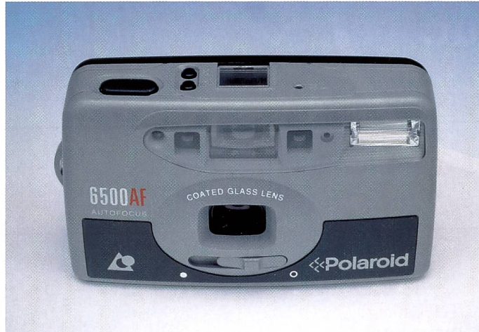
Die beiden APS-Modelle von Polaroid präsentieren sich in einem modernen Design und werden in einem Set mit Tasche, Batterie und Film verkauft.

Die Polaroid 6500 besitzt ein Zweizonen-Autofokus. Die Nahaufnahmegrenze liegt für die Polaroid 6500 bei 90 cm, für die 5500 bei 1,2 m. Die von