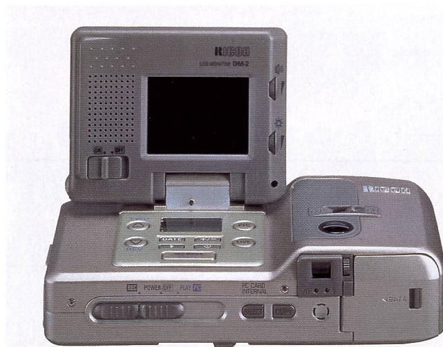
Die Ricoh RDC-2 ist mit einem aufklappbaren Farbmonitor sehr handlich und gehört mit 768 x 576 Pixel zur gehobenen Mittelklasse

Auffallend an der 300 Gramm schweren Sony DSC-F1 ist der um 180° Grad nach hinten schwenkbare Objektivträger, was ausgefallene Fotostandorte ermöglicht. Das Fixfokusobjektiv 1:2,0/4,8 mm entspricht 35 mm bei Kleinbild. Die kurze Brennweite ergibt einen Schärfereich von etwa 0,7 m