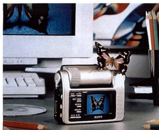
Originell: Sony DSC-F1 mit einem schwenkbaren Objektiv

bis unendlich und in der Makrostellung von ca. 8 bis 25 cm. Die TTL-Belichtungsmessung kann via Menü beeinflusst werden (Gegenlicht), die Belichtungszeiten werden automatisch angesteuert oder lassen sich per Menü von 1/7,5 s bis 1/1000 s manuell variieren. Die Auflösung beträgt 640 x 480 Pixel und die Farbtiefe 24 Bit. Als Sucher dient ein 1,8" TFT (aktiv) LCD-Farbmonitor. Der Helligkeitsregler ist gegen ungewollte Verstellung so gut geschützt, dass er selbst die normale Bedienung erschwert. Der Bildspei-