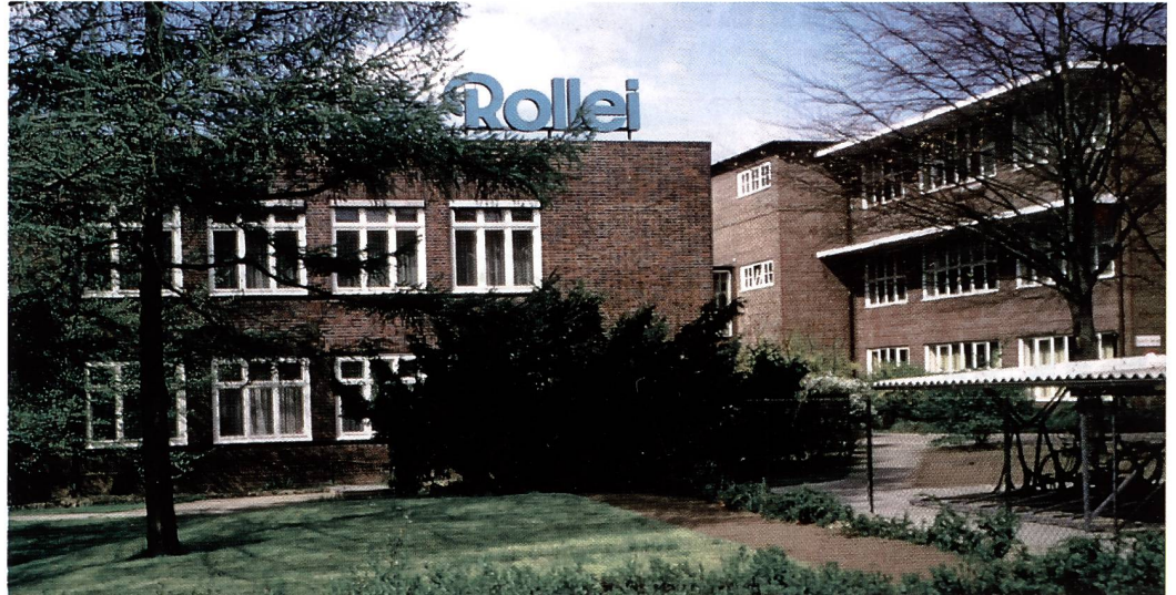
Im Hauptsitz von Rolleil in Braunschweig ist seit einem Jahr das RolleilSamsung F+E-Zentrum untergebracht