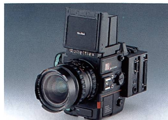
Professionelle Mittelformatkameras bleiben das Kerngeschäft

des Unternehmens vorgibt und es hervorragend versteht, seine Mitarbeiter zu motivieren. Man ist zu Recht stolz auf das «Made in Germany» und die soeben erworbene Zertifizierung ISO 9001.