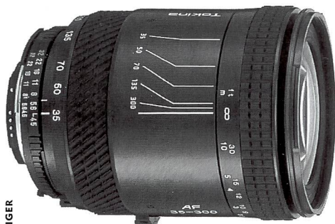
Tokina AF 4,5-6,7/35-300 mm

Ob Sie mit Canon, Minolta, Nikon oder Pentax AF fotografieren, mit dem neuen 35-300-mm-Zoom von Tokina haben Sie die Situation schneller im Griff. In einem strapazierfähigen Metallgehäuse von nur 10,1 Zentimeter Länge bietet dieses besonders vielseitige Objektiv eine profitaugliche Hochleistungsoptik zu einem auch für Amateure attraktiven Preis: Fr. 698.-.