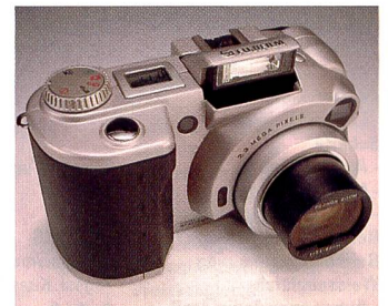
Hervorragende technische Ausstattung: Fujifilm MX-2900

Digitalkameras werden im Zusammenhang mit dem Internet immer wichtiger, denn das weltweite Kommunikationssystem beschränkt sich keineswegs nur auf Geschriebenes. Je länger je mehr werden auch Bilder über «das Netz der Netze» ver-