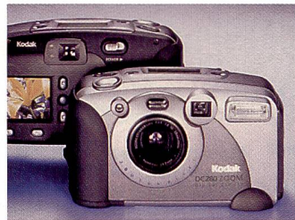
Kodak DC 260 Zoom mit GPS-Navigation für Standortangabe.