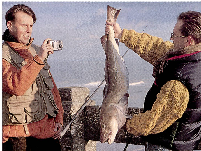
Erlebnisse digital festgehalten. Immer mehr Leute benutzen Digitalkameras für die Kommunikation im Internet.

Digitalkameras mit mehr als 1,5 Mpix gehen ganz klar in Führung: Immer bessere Bildqualität bei günstigem Preis. Wir haben die wichtigsten Modelle für Sie in einer Marktübersicht zusammengestellt.