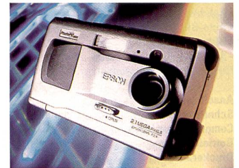
Nicht nur Fotofirmen sind im Geschäft: Epson PhotoPC 800.

Alle Modelle lassen sich am heimischen TV anschliessen, damit die Bilder am Fernsehbildschirm betrachtet werden können. Die serielle Schnittstelle dient der Datenübertra-