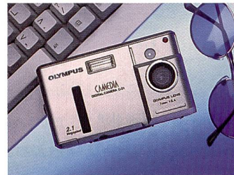
Die Olympus Camedia C21 ist eine der kleinsten des Marktes.