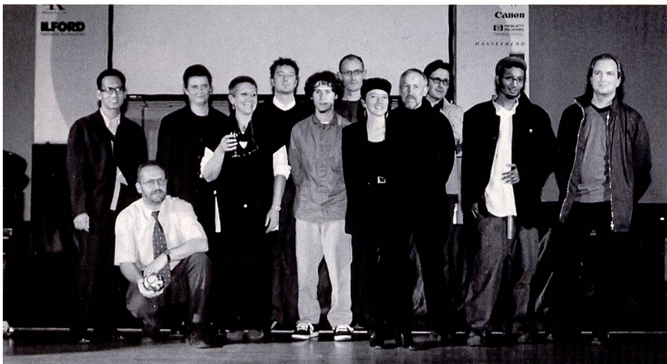
Die Preisgewinner des 1. SBf-Award. Der 5. November – Tag der Preisverleihung im Konservatorium Zürich – war für sie ein Freudentag.