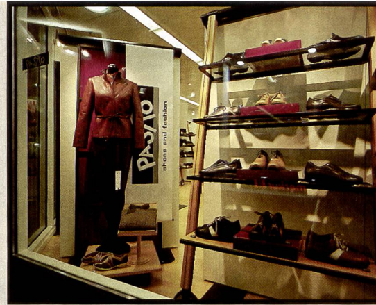
Treffsicher: Die Belichtungsmessung der Mamiya 7 II lässt selbst in kritischen und kontrastreichen Situationen nichts zu wünschen übrig.

1:4,5/150 mm Teleobjektiv, sowie ein 1:8/210 mm Tele. Für die Brennweiten 43 mm 150 mm werden Aufstecksucher als Zubehör geliefert. Diese dienen aber lediglich dazu,