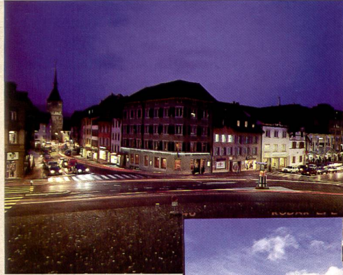
Mehr Format: Das Bildformat der Mamiya 7 II zeigt mit 56 x 69,5 mm mehr Bild im beliebten Seitenverhältnis 4:5.

Das Quadrat lässt dem Fotografen die Freiheit der Ausschnittwahl, der erst nach der Aufnahme festgelegt wird, falls das Quadrat nicht passt.