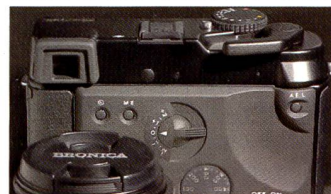
Übersichtliche Bedienelemente auf der Rückseite der neuen Bronica RF 645.

Auf der photokina überraschte der Mittelformat-Spezialist Bronica mit einer neuen MF-Messucherkamera im Format 6 x 4,5 cm. Die RF 645 kommt ohne Autofokus aus, hingegen bietet sie neben der manuellen Nachführmessung auch Zeit- und Programmautomatik. Die schnellste Verschlusszeit beträgt 1/750 Sekunde, dank Zentralverschluss lassen