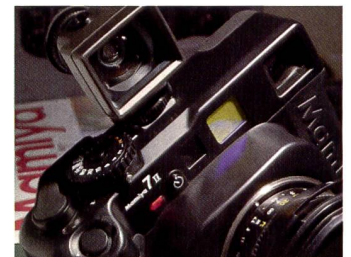
Zubehör: Der Aufstecksucher der Mamiya 7 II mit eingebauter Wasserwaage.

den gesamten Bildwinkel zu kontrollieren. Die Kamera arbeitet mit mittenbetonter Messung und verfügt über Zeitautomatik.