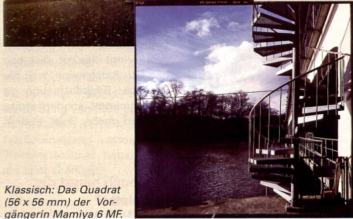
Klassisch: Das Quadrat (56 x 56 mm) der Vorgängerin Mamiya 6 MF.

schlusszeit der Zentralverschlussobjektive nur 1/500 Sekunde. Nah- und Makroaufnahmen sind nur mit einem eher komplizierten Nahvorsatz zu realisieren.