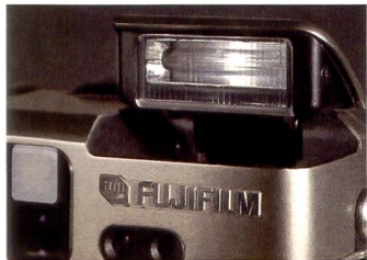
Alles dabei: die Fujifilm GA645 hat als einzige MF-Kompakte einen eingebauten Blitz.

winkelobjektiv und die GA645Zi Professional mit fest eingebautem 1:4.5 - 6,9/55 bis 90 mm Zoomobjektiv. Das entspricht einem 34 bis 56 mm Objektiv im Kleinbildformat. Fotografieren mit der Fujifilm GA645Zi Professional ist das reinste Vergnügen. Fast wie eine Kleinbildkompaktkamera verfügt sie über Programmautomatik, Autofokus und ein (fest eingebautes) Zoomobjek-