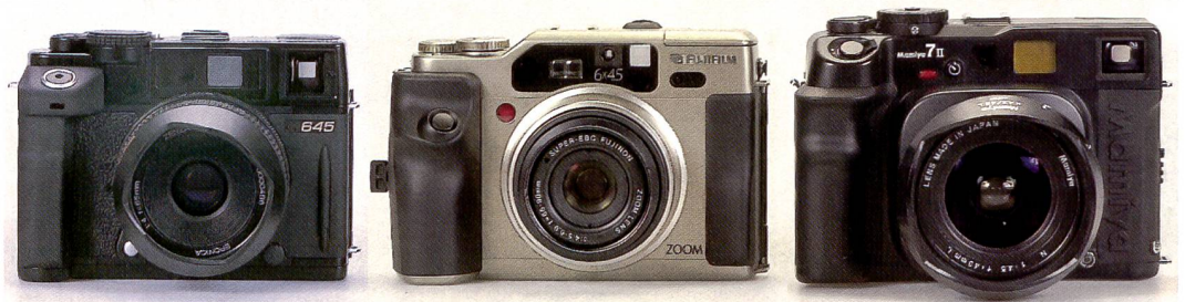
Drei Mittelformat-Musketiere: Bronica RF 645, Fujifilm GA645Zi Professional, Mamiya 7 II

Mittelformatkameras sind gross und schwer, das wird jedenfalls immer wieder behauptet. Weit gefehlt: Messucherkameras für das Mittelformat sind nicht nur überraschend handlich, sie bieten ein hohes Mass an Komfort und Qualität.