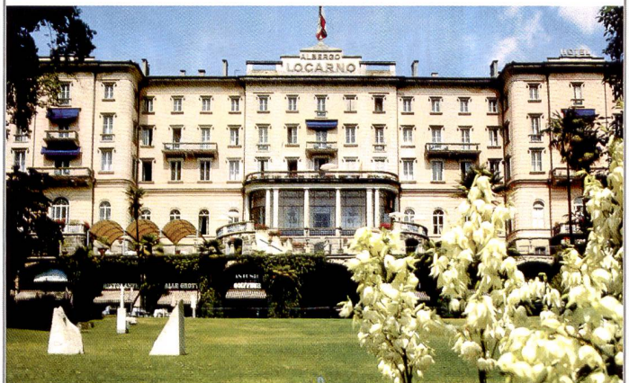
Unser Tagungsort: Grand Hotel Locarno

Grazie mille Marco Garbani und bis bald im Ticino