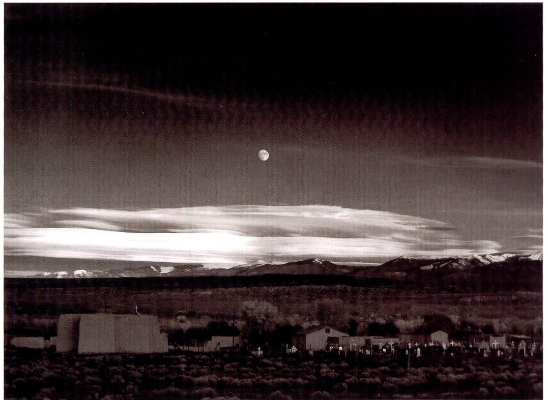
«Fotografie ohne Umwege», Ansel Adams, ein erfolgreicher Buchautor und Lehrer, perfektionierte die Schwarzweiss-Fotografie. Das Zonensystem erlaubte ihm, die Tonwerte genau voraus zu berechnen.