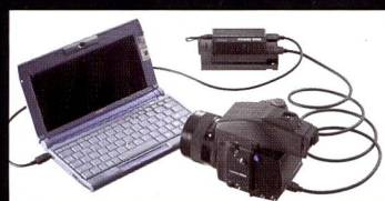
Phase One Portable Lösung