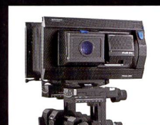
FlexAdapter für 4x5" Kameras