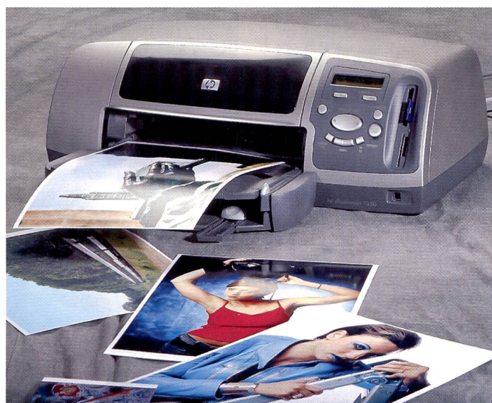
HP macht Druck: Für Bedienung, Bildqualität und Druckgeschwindigkeit erhält der Photosmart 7350 durchwegs gute Noten.

Hewlett-Packard setzt auf Gesamtlösung: Kamera, Dockingstation und Drucker mit einfacher Bedienung für das komplette Heimstudio. Wir haben die neueste Lösung von HP in der Praxis erprobt.