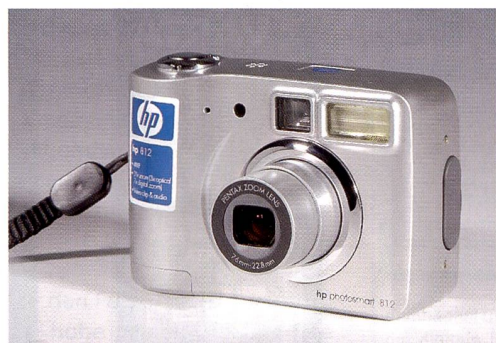
Die HP Photosmart 812 ist auf einfachste Bedienung ausgelegt.

und Bearbeitungsprogramm «ACDSee». Aufgenommene Bilder können über ein Kartenlesegerät auf den Computer überspielt werden. Auch ein USB-Anschluss für den direk-