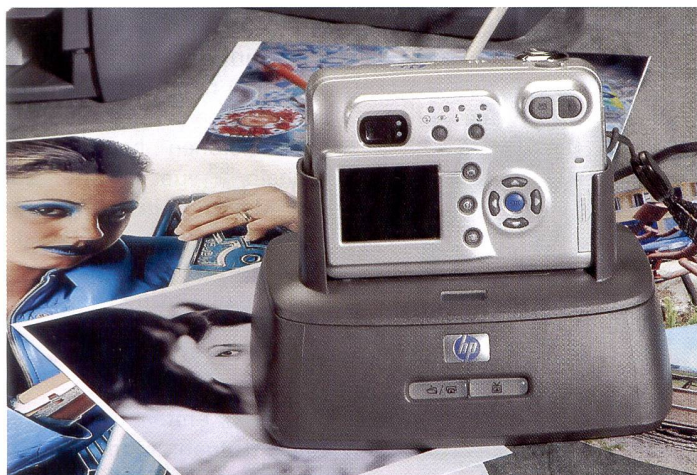
Die Dockingstation vereinfacht den Datentransfer an den Computer oder wie hier direkt an den Drucker.

auch anderes Papier verwenden. Aber das HP-Papier hat eine Perforation. Nach dem Druck muss ein Streifen am Ende des Papiers entfernt werden, der nicht bedruckt ist. Verwendet man nun ein anderes Papier, ohne diese Perforation, bleibt ein weisser, unbedruckter Streifen übrig. Wird A4-Papier eines Fremdherstellers verwendet, treten keine Probleme auf. Der Photosmart