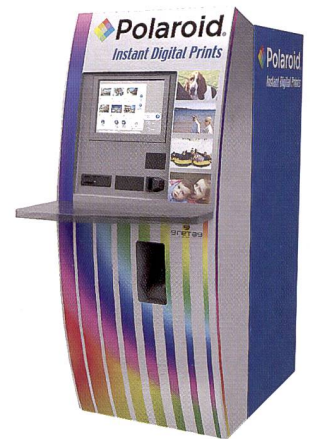
Die Polaroid Print-Station wird von Gretag gebaut.

steigende Kapazität auf. Die XD-Card beispielsweise soll dereinst bis zu 8 GB Speicherplatz bieten. Eine CD, wie sie bei den Order Stations zum Einsatz kommt hingegen nur gerade 700 MB. Peter Wagen