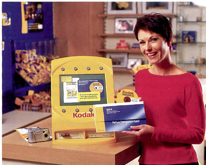
Durch Fotokioske werden Fotogeschäfte wieder attraktiver: Viele Kunden schätzen die Möglichkeit der Selbstbedienung.

Der Begriff «Fotokiosk» geistert seit geraumer Zeit durch die Fachmedien. Geradezu magisch soll der Fotokiosk die Kundschaft anziehen und zum Ausbelichten von Digitalbildern animieren. Welche Hoffnungen setzt man in der Branche auf die Kiosklösungen?