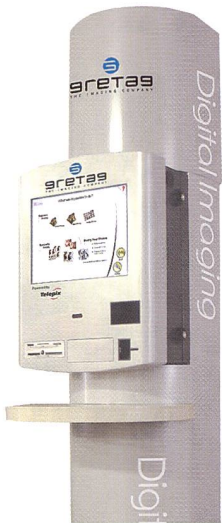
Die Gretag-Lösung in extravaganterem Design.

In der Branche herrscht Einigkeit darüber, dass nur die digitale Ausgabe von Bildern Zukunft hat. Ausserdem braucht es dringend Anreize, um Kunden, die digital fotografieren und ihre Bilder nicht ausbelichten lassen, in den