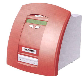
Der Agfa Cube ist der kleine Bruder der bekannten e-box.