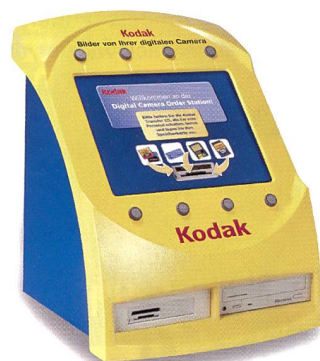
Das Kodak Picture Maker ist modular ausbaubar.

den einen Topservice zu bieten. Wir wollen auch jenem Fachhändler, der noch kein Minilab hat, die Möglichkeit geben, die digitalen Daten sei-