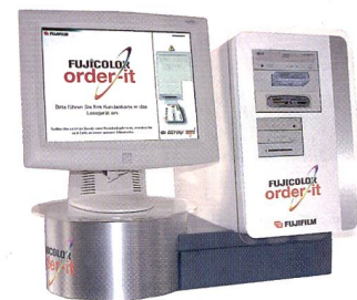
Die Fuji Order Station hat den grössten Bildschirm.

Das System kann gekoppelt werden mit einem Scanner, um den vielfach geäusserten Kundenwunsch nach «Bild-ab-Bild» zu erfüllen. Neben einfachen Bildern kann der Kunde bei Kodak auch Gruskkarten oder Sticker selbst herstellen.