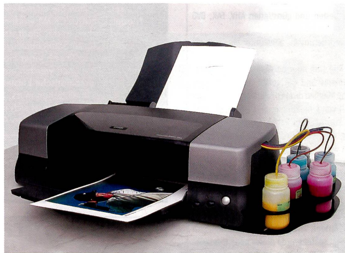
Unsere Versuchsanordnung bestand aus einem Epson 1290 Inkjetdrucker. Statt Tintenpatronen im Druckkopf wurden externe Tanks verwendet.

Schon seit geraumer Zeit haben sich Inkjet Drucker in Büro und Haushalt etabliert. Mehr und mehr setzen auch Fotografen auf Tintenstrahl-Drucker für die Bildausgabe. Der Umgang mit Tinte und Papier will für ein professionelles Resultat allerdings gelernt sein.