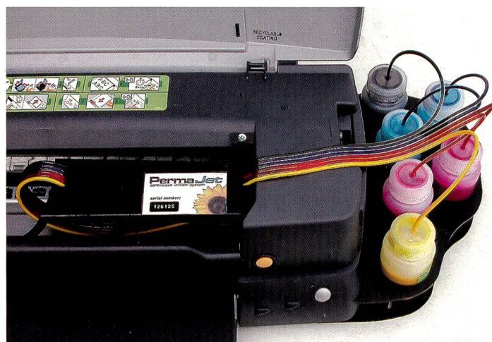
Das Permaflow-System von Permajet aus der Nähe betrachtet.

Wem das alles zu kompliziert erscheint, bleibt ein Trost. Immer mehr Profis bieten den digitalen Ausdruck auch als Dienstleistung an. Gegen entsprechende Bearbeitungsgebühr bedrucken Fotografen, kleine Firmen und Labors auf Wunsch fast alles, was sich überhaupt bedrucken lässt. Zudem findet die Methode auch immer mehr Anhänger im Fachhandel, wo neben dem klassischen Minilab oder gar als Ersatz desselben ein Inkjet Printer im Einsatz steht. Eric A. Soder