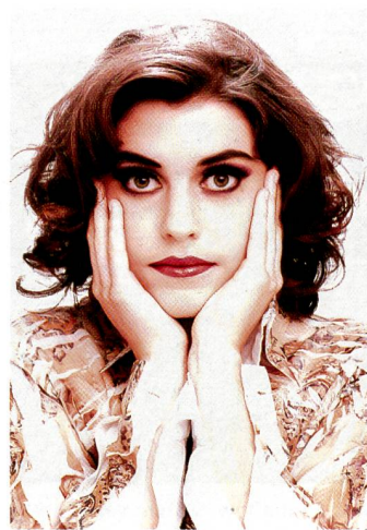
Diese Porträts auf Papier mit seidener Oberfläche. Mit dem Inkjet Verfahren bleibt die Bildausgabe in den Händen des Fotografen.

beitet. Das Bubble Jet Verfahren basiert auf Hitzeeinwirkung. Durch die Hitze wird die Tinte im Druckkopf kurzzeitig so stark erwärmt, dass sie verdampft und explosionsartig aus der Düse geschleudert wird. Unmittelbar nach dem Austritt wird die Heizung ausgeschaltet, wodurch ein Unterdruck entsteht und neue Tinte angesaugt wird. Beim piezoelektrischen Verfahren von Epson hingegen wird die Tinte durch einen unter Spannung stehenden Piezokristall unter hohem Druck aus dem Kapillarrohr geschleudert.