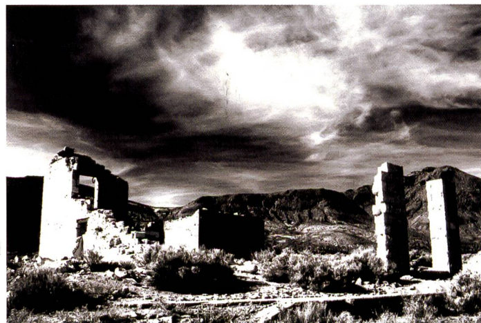
Der infrarotähnliche Effekt beruht auf der Kontraststeuerung mittels Gradationskurven und Manipulationen im Kanalmixer. Der Ausdruck mit Farbtinten erfolgte im RGB-Modus bei stark verringerter Farbsättigung.

Hier sind einmal grundsätzlich zwei Typen zu unterscheiden, nämlich Farbstoff- (Dye Inks) und Pigmenttinten. Selbstredend sind Papiere für beide Tintentypen auf dem Markt erhältlich.