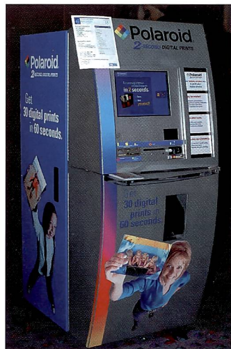
Das Polaroid Opal hat die Nase vorn, wenn es ums Tempo geht.

Üblicherweise setzt man in Kiosken, die nicht mit einem Minilab verbunden sind, für die Prints das Farbsublimations-Verfahren ein, das eine farbiges Papierbild liefert. Nur das Polaroid Opal Verfahren ist davon verschieden. Es ist zwar auf 4 x 6 Inch begrenzt, dafür aber umso schneller, indem es innerhalb von rund zwei Sekunden das Bild liefert, also 24 Bilder innerhalb einer Minute. Inkjet Kioske wurden nicht angeboten, wohl aber Combo Versionen, die einen grossformatigen Inkjet Printer anhängen können und sporadisch an Stelle eines Minilabs für Grossbilder eingesetzt werden können. Gewisse Kioske von derselben Firma sind nur für den Anschluss ausser Hause gebaut, als Input Station, wie etwa die Agfa Image Box oder die Fuji Order Station Serie ,