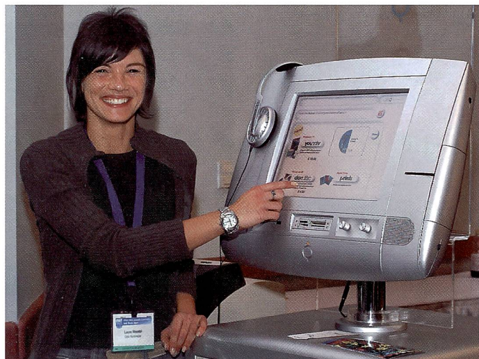
So einfach ist das: Der Touchscreen Monitor ist praktisch allen Kiosklösungen gemeinsam. Im Nu sind die Bilder ausgelesen und der Auftrag erteilt.

Bereits vor zwei bis drei Jahren war auf der PMA eine Welle von Selbstbedienungs-Geräten zu sehen, die man als Kiosk bezeichnet. In Anlehnung an Kodaks Picture Maker Stationen können die Kioske nun auch besonders für digitale Bilddaten angewendet werden.