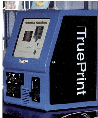
Umfassende Lösung mit Anbindung an Minilab bei Olympus.

ren Karten sind ebenfalls möglich oder werden in Zukunft ohne grosse Schwierigkeiten nachgerüstet.