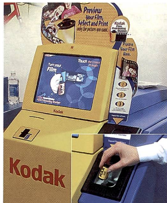
Filmrecycling: Statt der Negative gibts bei Kodak eine CD.

Kodak vertreibt Bilder Kiosks seit 10 Jahren und hat weltweit etwa 50'000 in Betrieb, davon 24'000 allein in den USA. Das übliche Material dafür ist das thermografische Papier, wenn der Kiosk nicht direkt oder indirekt an ein digitales Minilab angeschlossen ist, wo dann die regulären Farbbilder gedruckt werden. Wirtschaftlich ist das Farbbild vom AgX Colorpapier natürlich billiger, zwischen 4-7 Rappen, während die Kosten für das Farbsublimationspapier bei ca. 30 Rappen pro Blatt liegen. Es ist eine Frage der Mengenausgabe. Der G3 Kiosk