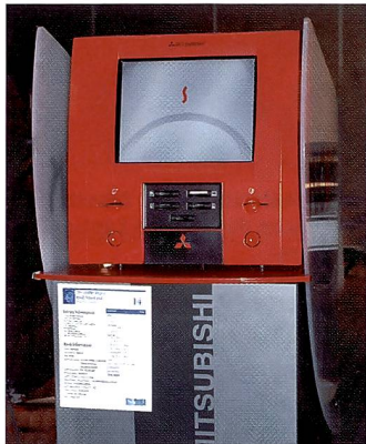
Auch Mitsubishi bietet Lösungen für die dezentrale Bildausgabe.

Wir wagen nicht vorauszusagen, dass hiermit die ganze Fotoindustrie umgestellt wird, oder dass es