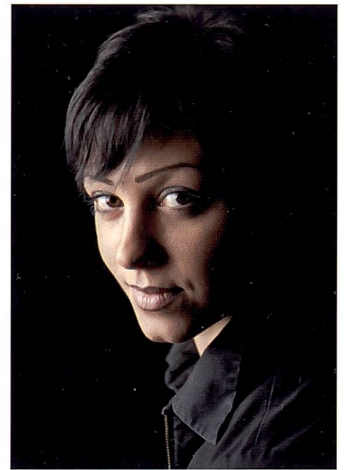
Hoher Dynamikumfang: Sattes Schwarz, differenzierte Lichter.

Es muss an dieser Stelle noch einmal wiederholt werden, wie wichtig es ist, die Bilder im RAW-Format abzuspeichern. Selbstverständlich können Bildjournalisten, die unterwegs sind und immer unter einem enormen Zeitdruck stehen, keine Zeit darauf verwenden, ihre Bilder noch lan-