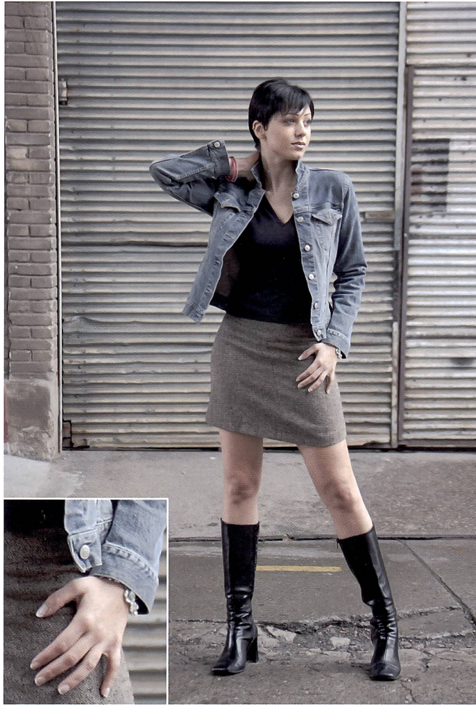
Ein Moiréeffekt ist in der Originaldatei nicht auszumachen und das Rauschen hält sich trotz ISO 800 in engen Grenzen.

Die Naturaufnahme mit dem japanischen Pavillon überzeugt durch die differenzierte Darstel-