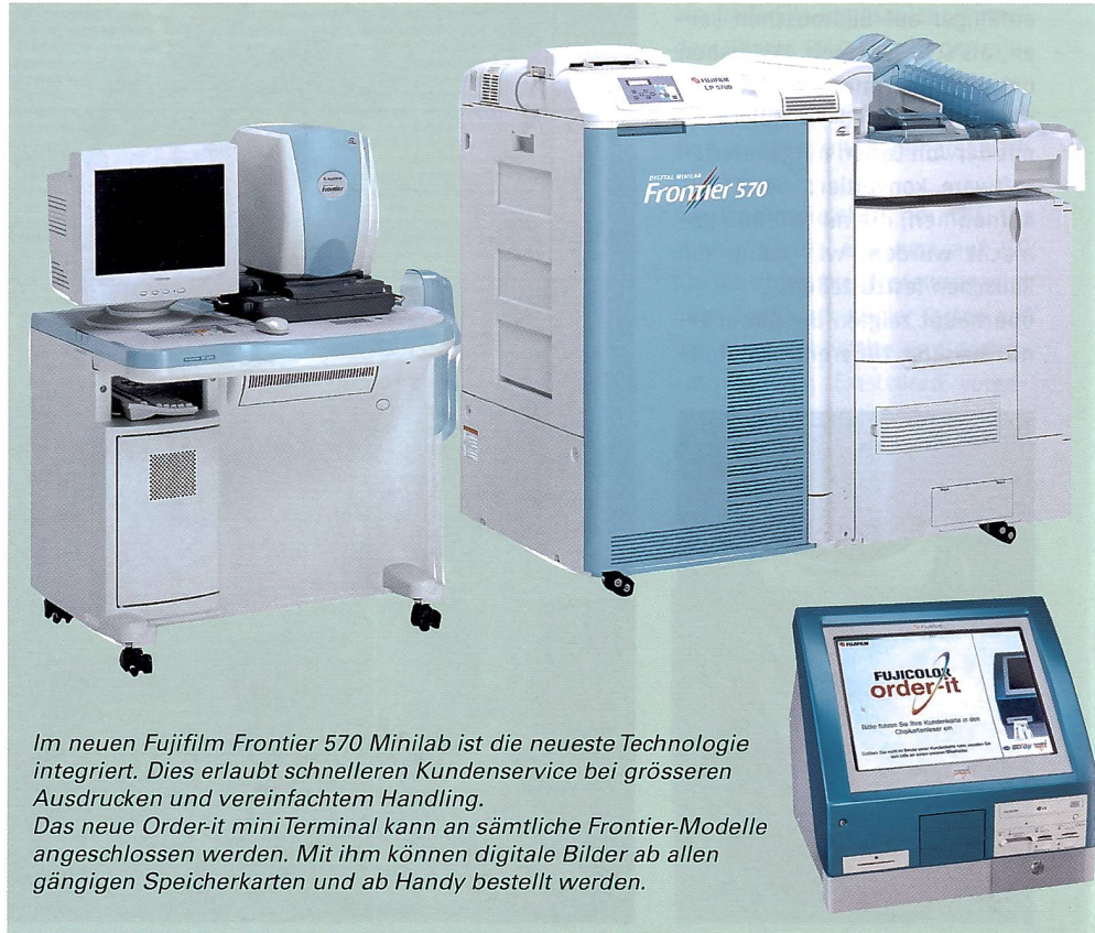
Im neuen Fujifilm Frontier 570 Minilab ist die neueste Technologie integriert. Dies erlaubt schnelleren Kundenservice bei grösseren Ausdrucken und vereinfachtem Handling. Das neue Order-it mini Terminal kann an sämtliche Frontier-Modelle angeschlossen werden. Mit ihm können digitale Bilder ab allen gängigen Speicherkarten und ab Handy bestellt werden.

Überragende Qualität für den Schnellservice Mit dem Frontier 570 erweitert die Fujifilm (Switzerland) AG die Palette ihrer digitalen Minilabs. Obwohl kleiner in den Abmessungen als die Frontier 355/375, übertrifft es seine Vorgänger: hervorragende Printqualität mit sagenhaften 600 dpi, Papierbreite von bis zu 30,5 cm, sowie erstmalig eine vollautomatische Korrektur roter Augen. Mit seiner effektiven maximalen Leistung von 1800 Prints/h im Format 10x15 cm setzt das Frontier 570 auch punkto Leistung neue Massstäbe. Dies