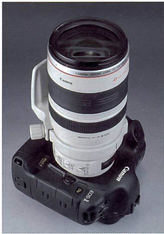
Das neue 28–300 mm IS Zoomobjektiv sorgt für knackige Schärfe.

Der CMOS-Sensor ist mit einem Tiefpassfilter versehen, der Falschfarben- und Moiré-Effekte reduziert. CMOS-Sensoren werden mitunter nachgesagt, dass sie anfälliger auf Bildrauschen seien, als CCD-Sensoren. Wir haben unsere Aufnahmen im RAW-Format abgelegt und anschliessend mit der von Canon mitgelieferten Software konvertiert. Selbst bei Aufnahmen, die mit ISO 800 gemacht wurden, war kaum ein Rauschen festzustellen. Überhaupt zeigten die Bilder eine äusserst differenzierte Ton-