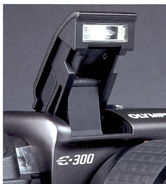
Der lange Weg beim Ausklappen des Blitzes hilft gegen rote Augen.

den aus, reicht aber aus, um aus kurzen Distanzen die Schatten aufzuhellen oder kleinere Szenarien auszuleuchten. Ausserdem lässt sich auch eine Studioblitzanlage mit dem Einbaublitz zün-