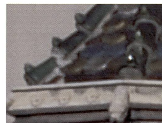
Ausschnitt: In punkto Schärfe werden grosse Fortschritte erzielt.

Unsere Olympus E-300 war noch ein Vorserienmodell, bei dem unter anderem der Weissabgleich noch nicht freigegeben