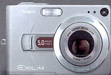
EX-Z50 2 Zoll TFT-Farbdisplay 5,0 Megapixel SUPER LIFE-Battery