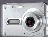
EX-S100 ultraflach 2,8fach optischer Zoom „keramische Linse“