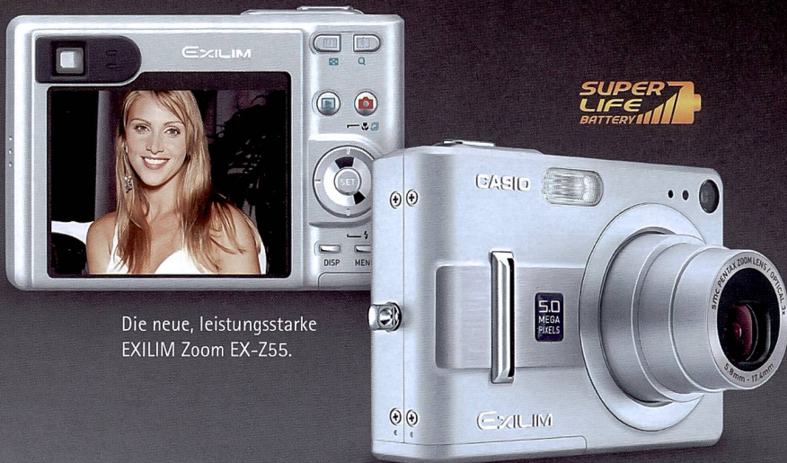
Die neue, leistungsstarke EXILIM Zoom EX-Z55.