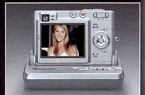
Auch erhältlich: die neue EX-Z50 mit 2 Zoll TFT-Farbdisplay.

Extralanger Fotospaß dank der einzigartigen SUPER LIFE-Battery.