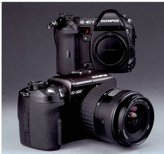
Die Olympus E300 überrascht mit einem TTL-Spiegelsucher, das typische Pentaprisma hingegen (hinten an der E1) fällt weg.

Der von Olympus an der Photokina 02 angekündigte «4/3 Standard» weckte Hoffnungen, aber auch Skepsis. Spätestens zur Photokina 04 hätte man eine E2 erwartet, stattdessen stellte Olympus die E300 vor. Eine überraschende 8 Mpix-Kamera in aussergewöhnlichem Design.