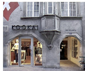
Diese nicht ganz einfache Mischlichtsituation hat die E300 sehr gut gemeistert.

war. Deshalb ist keine schlüssige Beurteilung der Bildqualität möglich. Die Kamera hatte auch einen Hang zur Unterbelichtung, worauf wir aber bereits von Olympus hingewiesen worden waren. In der endgültigen Version der E-300 werden diese Fehler noch behoben. Alles in allem ist die Olympus E-300 eine vielversprechende Kamera, mit 8 Mpix üppig ausgestattet und in einem aussergewöhnlichen Design und zu einem attraktiven Preis. Zudem erschliessen sich dem Anwender die ganzen Systemzubehöre des Olympus 4/3 Systems.