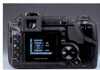
Die Menüführung der E300 ist unkompliziert und logisch.

den, nämlich über die Fozzelle. Oder man montiert ein IR-Filter vor dem Einbaublitz und zündet die Blitzgeräte, die mit IR-Empfänger ausgestattet sind. Wer mehr Blitzleistung wünscht, kann eines der Blitzgeräte aus dem Olympus-System verwenden. Diese lassen sich auf den zweiten Verschlussvorhang synchronisieren, verfügen über eine