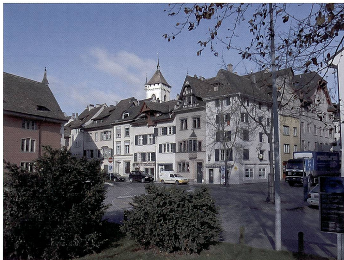
Trotz einer leichten Unterbelichtung ist das Bild sehr differenziert ausgefallen. Die Farben des Vorserienmodells wirken noch etwas kühl.

liches Tempo. Zwar ist die E-300 auch nicht langsam, doch im Serienbildmodus ist nach drei Aufnahmen erst einmal Schluss. Die E1 ist aber in der Lage, auch längere Serien mit bis zu 12 Aufnahmen bei 2,5 Bilder pro Sekunde anzufertigen. Nach 12 Aufnahmen beginnt die E1 mit dem Download an die Speicherkarte und ist auch gleich wieder für eine neue Aufnahme bereit, sobald das erste Bild auf der Karte gespeichert ist.