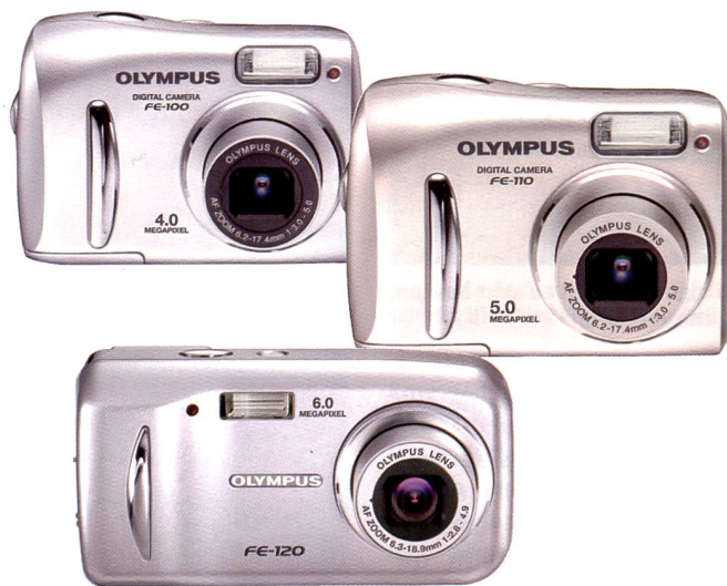
Einsteigermodelle hoher Qualität: Olympus FE-100, FE-110 und FE-120

Olympus hat mit dem Ziel, die digitale Fotografie für jedermann erschwinglich und einfach beherrschbar zu machen mit dem Kernsatz FE – für friendly and easy – das Sortiment mit einer weiteren Kamera der mju-Serie und einem günstigen Thermosublimationsdrucker erweitert.