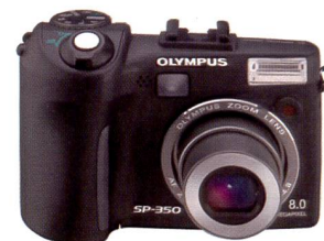
Olympus SP-350: 8 Megapixel

Mit Einbruch der Dämmerung zeigt die 6-Millionen-Pixel-Kamera µ Digital 600, was sie wirklich kann: Das 6,4 cm grosse LCD stellt das Motiv auch bei schlechten