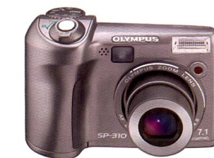
Olympus SP-310: 7,1 Megapixel

Die Olympus SP-500UZ ist mit einem 10fach-Zoomobjektiv (entspricht 38 – 380 mm bei einer 35-mm-Kamera) ausgestattet, das mit 1:2,8 – 3,7 über den gesamten Brennweitenbereich besonders lichtstark ist. Die Kamera verfügt über