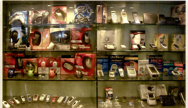
Im Flextronics-Werk in Xixiang bei Shenzhen werden verschiedenste Produkte für Weltmarken produziert.