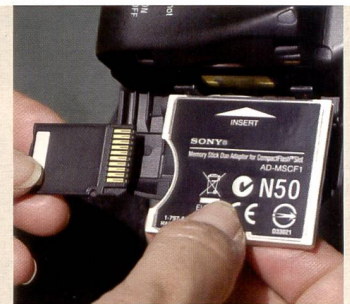
Die Alpha 100 nimmt über einen CF-Adapter auch Memory Sticks auf.