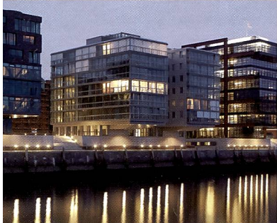
↑ Sandtorkai, Hafencity, Hamburg Stade de Suisse, Wankdorf, Bern →