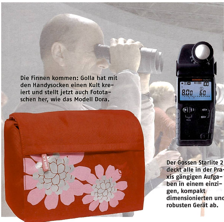
Die Finnen kommen: Golla hat mit den Handysocken einen Kult kreiert und stellt jetzt auch Fototaschen her, wie das Modell Dora.

Im Unterschied zum bekannten Zigview S2, der das Monitorbild vom Kamerasucher «abfilmt», nimmt Zigview S2 live sein Bild aus dem Video-Ausgang der Kamera und ist daher nur an SLRs