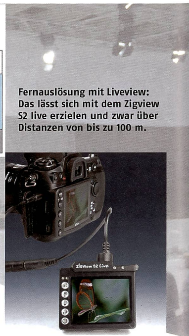
Fernausslösung mit Liveview: Das lässt sich mit dem Zigview S2 live erzielen und zwar über Distanzen von bis zu 100 m.

Allround-Belichtungsmessers. Er deckt alle in der Praxis gängigen Aufgaben in einem einzigen, kompakt dimensionierten und robusten Gerät ab. Der Starlite 2 übernimmt alle Messarten für Dauer- und Blitzlicht bis hin zum Zonensystem mit Direktanzeige der Werte. Die Objektmessung ist mit 1° und 5°- Messwinkel über Sucher möglich. Für die Lichtmessung stehen Diffusoreinstellungen mit sphärischer oder planer Charakteristik zur Verfügung. Als Cine-Meter besitzt der Starlite 2 eine 180°-Umlaufblende. Zusätzliche Sektorengrössen können in 5°-Schritten gewählt werden. Standardisierte und anglo-amerikanische Messeinheiten werden direkt ausgegeben. Für