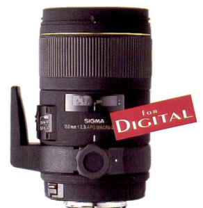
SIGMA 150 mm Macro F2,8 EX DG HSM

Dans le jeu subtil des ombres et des lumières, un lézard se cache dans le branchage d'un buisson. L'objectif télémacro à grande ouverture 150 mm Macro F2,8 EX DG HSM permet la prise de vue rapprochée jusqu'à la taille réelle 1:1. Deux éléments en verre spécial à faible dispersion (SLD) assurent une qualité optique hors du commun. Le système de mise au point interne à éléments flottants corrige efficacement l'astigmatisme et les aberrations sphériques. La technique HSM dont est pourvu l'objectif procure une mise au point silencieuse et rapide permettant en tout temps une intervention manuelle. Pour un travail de prise de vue précis sur trépied à vitesse d'obturation lente, l'objectif est équipé d'un collier orientable et amovible. Grâce à la longueur focale idéale de l'objectif, il est aisé d'opérer en macrophotographie à bonne distance des sujets vivants de petite taille et d'obtenir ainsi des résultats de qualité professionnelle.