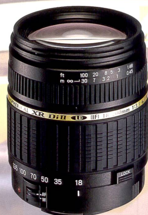
Les objectifs numériques ont été les stars discrètes de la PMA, ici le Tamron 18-200 mm.

sant des modèles convergents capables d'accueillir ordinateur portable, appareil photo, téléphone portable et assistant numérique.