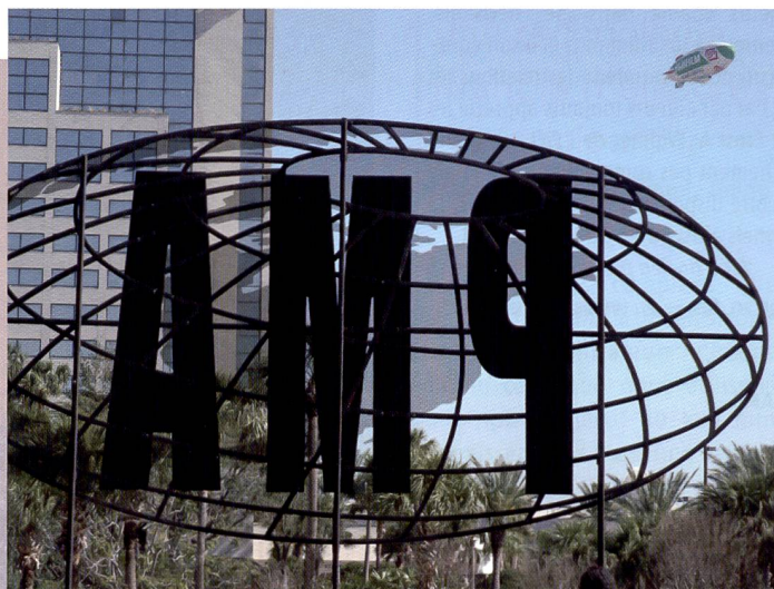
PMA 2005: pas de sensationnalisme, mais le salon a mis en vedette quelques nouveautés et tendances surtout dans le secteur des accessoires.