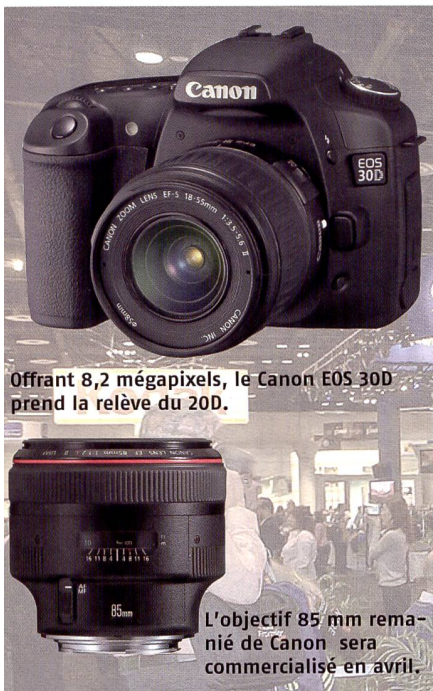
Offrant 8,2 mégapixels, le Canon EOS 30D prend la relève du 20D.

teur d'image pour le système 4/3. Mis au point en collaboration avec Panasonic, il a été présenté lors d'une conférence de presse en combinaison avec le Lumix DMC-L1. Ce nouveau reflex numérique à objectifs interchangeables constitue une tentative de Panasonic de percer sur le marché lucratif des D-SLR. Pour plus de détails, reportez-vous à la page 11. Leica a par ailleurs signalé qu'il faudra attendre l'été pour en savoir plus sur le nouveau boîtier à viseur numérique dont un prototype sera probablement présenté à la Photokina.