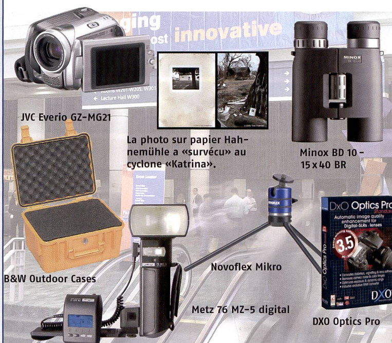
JVC Everio GZ-MG21

dans le secteur des «innovations». Cela est d'autant plus surprenant que ce ne sont plus les marques photo traditionnelles qui dominent l'exposition. J'ai également été surpris par le nombre incroyable de petits stands proposant des produits passionnants «made in China». La palette s'étendait de caméscopes de qualité supérieure à des lignes complètes de sacs. Enfin, la PMA, qui est plutôt axée sur le marché américain, ne peut renier son origine et son orientation sur le domaine du photofinishing.»