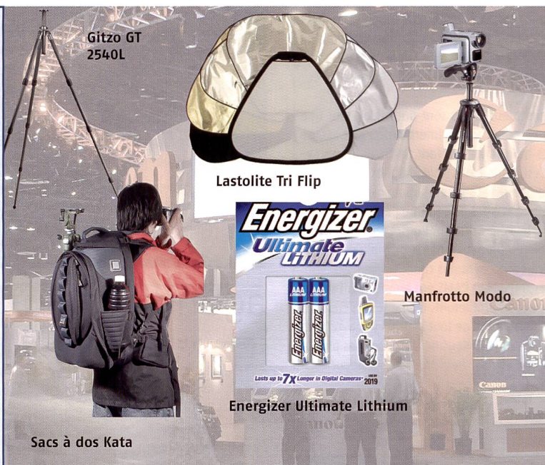
Sacs à dos Kata

Le fabricant a présenté le concept Tri Flip, un kit 8en1 de fourreaux réfléchissants pour insérer le