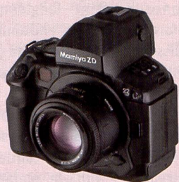
Le Mamiya ZD.

Mamiya a annoncé le transfert dans une nouvelle société de «Optical Equipment Division», fabricant d'appareils moyen format et d'objectifs. Cosmo Digital Imaging Company Ltd. a été fondée pour ce faire par Cosmos Scientific Systems Inc., qui produit des ordinateurs et des accessoires. Cette mesure permettra à Cosmo Digital Imaging de combiner le savoir-faire en matière de logiciels de la société mère avec les compétences photographiques dans la construction d'appareils de Mamiya. L'objectif visé est de consolider la position sur le marché de la photographie