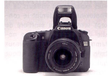
Le Canon EOS 30D tout comme le Nikon D200 disposent d'un flash intégré (nombre guide: 13).

JPEG, Nikon espère aussi intéresser les non-utilisateurs Nikon. Capture NX vous est aussi présenté dans ce numéro. Werner Rolli