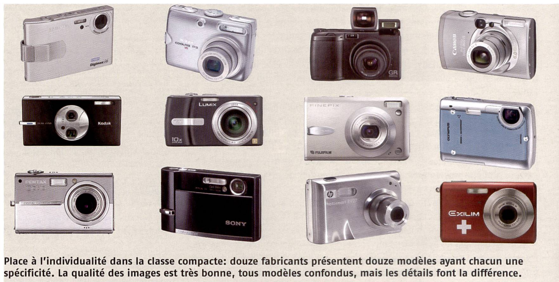
Place à l'individualité dans la classe compacte: douze fabricants présentent douze modèles ayant chacun une spécificité. La qualité des images est très bonne, tous modèles confondus, mais les détails font la différence.

teur d'image Anti Shake DSP et un écran couleur TFT de 6,4 cm. Chez le EX-Z60, ce sont également les valeurs intérieures qui dominent: le temps de latence est d'environ 0,002 seconde. Une fois mis sous tension, l'appareil est prêt à l'emploi au bout de 1,4 seconde et avec la fonction Best Shot, 33 modes de prise de vues sont par ailleurs disponibles au choix.