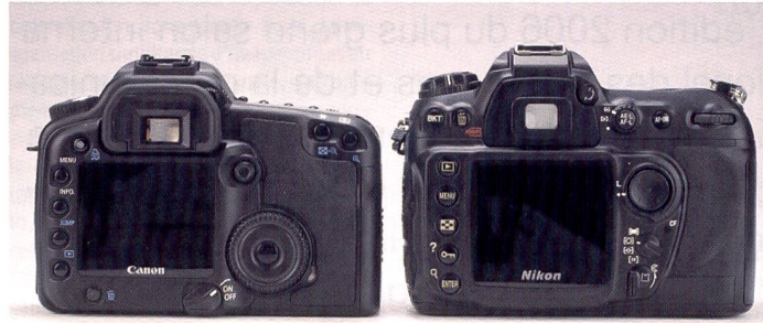
Concept épuré: le Canon EOS 30D (à gauche) et le Nikon D200 ont hérité des concepts d'utilisation éprouvés de leurs prédécesseurs ou de modèles professionnels plus onéreux. Les écrans ont gagné en taille et permettent d'observer les images confortablement même depuis un angle d'incidence de 170°, l'écran du D200 est même légèrement plus grand.

te d'installation des fonctions wi-fi. En lançant cet été le logiciel Capture NX qui offre des fonctionnalités complètes de traitement des fichiers RAW, NEF et