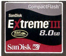
SanDisk Extreme III CompactFlash®