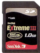
SanDisk Extreme III SD™