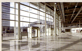
Aménagement spacieux de l'entrée nord