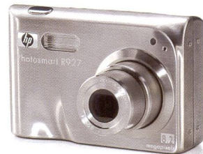
HP PHOTOSMART R 927

LA SEULE CHOSE QUI REND NOS IMPRIMANTES PLUS PERFOR- MANTES: NOS DIGICAMS