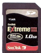
SanDisk Extreme III SD™