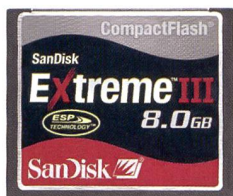
SanDisk Extreme III CompactFlash®