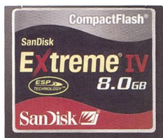
SanDisk Extreme IV CompactFlash®