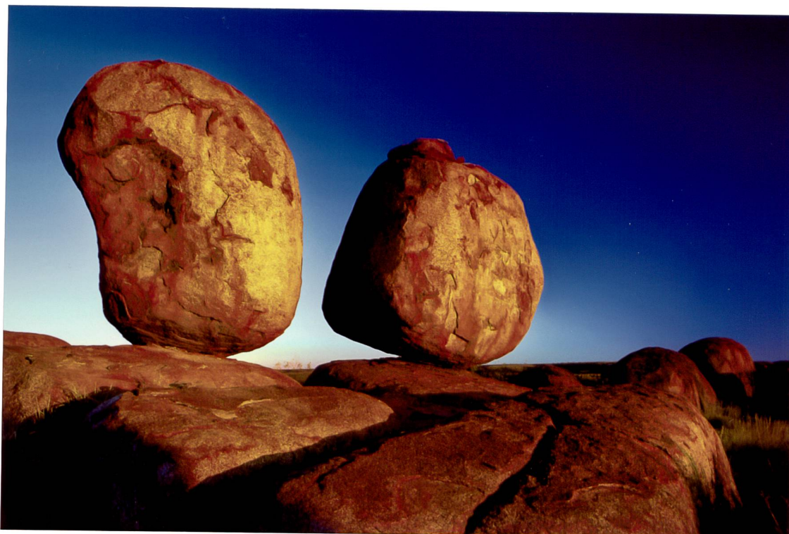
Photo : © Patrick Loertscher • Tirage original ILFORD ILFOCHROME® CLASSIC

fon +41 71 278 15 35 fax +41 71 278 15 37 www.foto-lautenschlager.ch info@foto-lautenschlager.ch