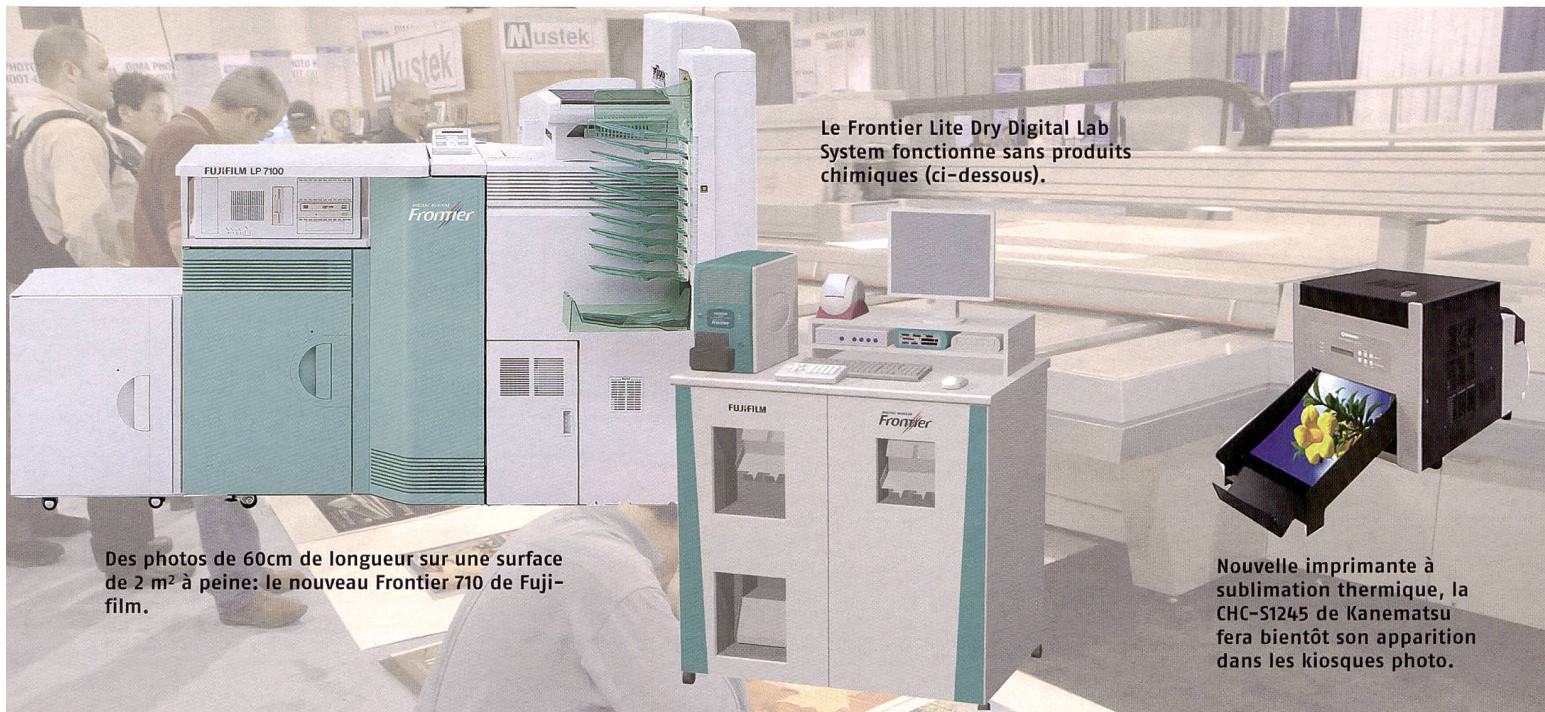
Le Frontier Lite Dry Digital Lab System fonctionne sans produits chimiques (ci-dessous).

lendriers, cartes de vœux et produits de ce type. La Xerox DocuColor 240/250 imprime différents supports jusqu'à 300 g avec une résolution de 2400 x 2400 dpi. Fujifilm a par ailleurs remanié son logiciel pour différents minilabs existants et propose des actualisations et mises à jour pour ces modèles. Le système Event Photo permet aux photographes événementiels de transmettre leurs photos sans fil s'ils le souhaitent à l'une des imprimantes numériques ASK-4000/ASK-4000 récemment lancées et de les intégrer dans des masques et cadres préparés.