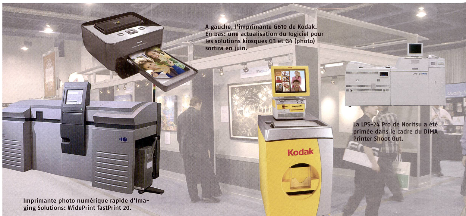
A gauche, l'imprimante G610 de Kodak. En bas: une actualisation du logiciel pour les solutions kiosques G3 et G4 (photo) sortira en juin.

Un kiosque avec écran panoramique et une imprimante flexible à