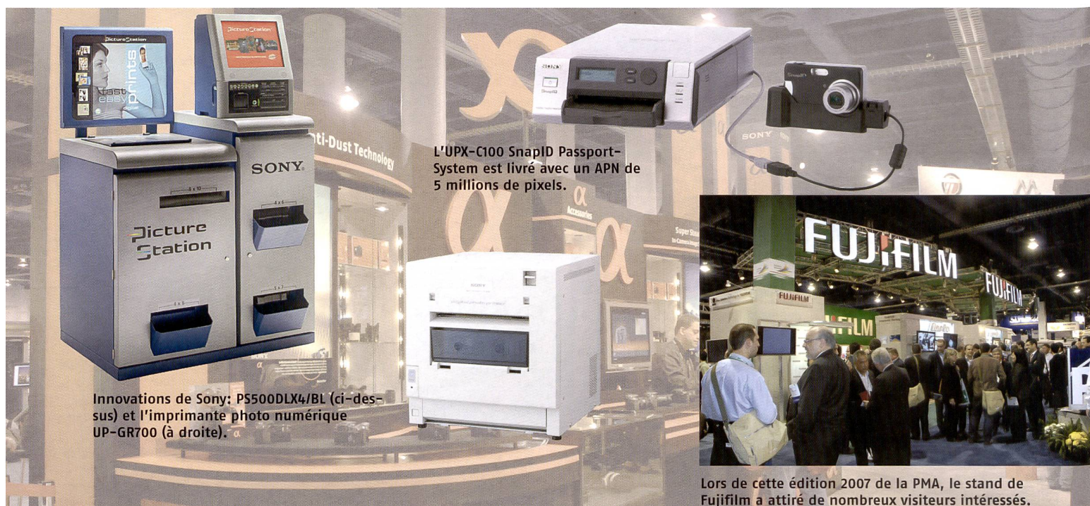
Innovations de Sony: PS500DLX4/BL (ci-dessus) et l'imprimante photo numérique UP-GR700 (à droite).

Créée pour le studio, le portrait, les mariages et événements, elle imprime les photos avec une finition mate conférant aux tirages un aspect plus évocateur des photos classiques que le résultat délivré par les modèles courants à sublimation thermique. Au verso, les photos sont automatiquement revêtues du sigle Copyright. Rapide et flexible, l'imprimante UP-GR700 délivre des tirages de