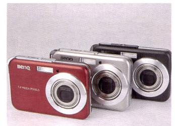
X pour ultra plat: nom de la série hyper tendance éponyme BenQ.

Les modèles E600/E605 doivent leur compacité à leurs objectifs rotatifs. L'encombrement est minimisé par la rotation des objectifs sur leur axe à l'entrée et à la sortie. Les utilisateurs à la recherche du «must» de la miniaturisation se tourneront vers les