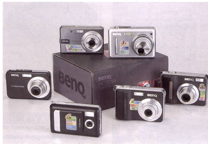
Créée de fraîche date, la marque mise sur un design cohérent et un bon rapport qualité/prix. Parallèlement à la vente dans les magasins spécialisés et chaînes de distribution, la marque cherche à occuper le créneau du commerce spécialisé en coopération avec Wahl Trading AG.

BenQ étoffe de plus en plus sa gamme d'APN que Wahl Trading AG distribue auprès des magasins photo spécialisés depuis la Professional Imaging. Quels sont les modèles du moment? Cet article vous présente une sélection de plusieurs produits vedettes signés BenQ.