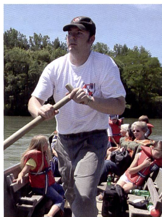
Même à la lumière riche en contrastes de l'après-midi, l'EOS 1D Mark III s'avère convaincant.

me de construction. Cependant, le moiré a généralement tendance à s'estomper lorsqu'on réduit le diaphragme. La brillance s'améliore elle aussi dès que l'ouverture du diaphragme est revue à la baisse. Il faut dire qu'avec une ouverture initiale de f2,8, le 16-35 mm possède une marge plus que suffisante. De légères distorsions et une perte de résolution sur les bords peuvent certainement être retouchées au laboratoire et ne devraient avoir aucune incidence dans le domaine d'utilisation visé par cet appareil.