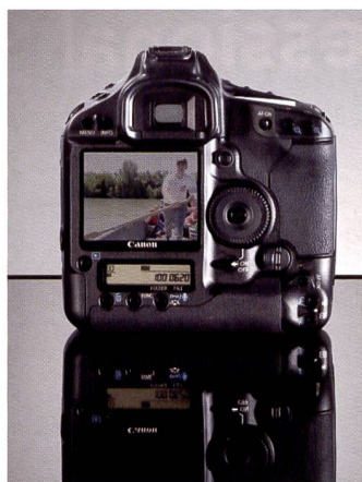
L'EOS 1D Mark III est le premier DSLR de Canon équipé de la fonction «Liveview».

La sempiternelle question de l'importance des pixels revient en permanence dans les entretiens avec les clients, amateurs photo et clients potentiels, notamment dans les foires ou manifestations. Pourtant la résolution ne joue pas un rôle si déterminant. En effet, cela fait belle lurette que les amateurs avertis sont équipés de reflex numéri-