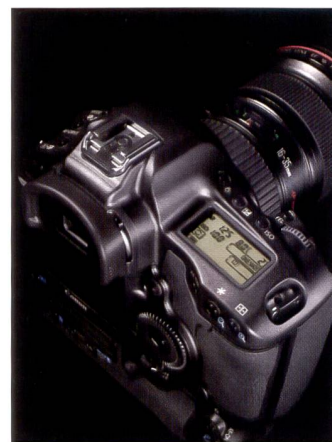
Le Mark III n'est pas professionnel que de «l'intérieur», l'extérieur aussi ne manque de rien.

et de pics chromatiques. La structure des menus de l'EOS-1D Mark III a été totalement remaniée et adaptée à la taille de l'écran ACL afin d'améliorer l'utilisation et la lisibilité. Une sélection de 57 fonctions définies par l'utilisateur permet au photographe de configurer confortablement son appareil en fonction de ses conditions de travail quoti-