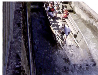
Ballade en bateau sur l'Aare immortalisée avec le Mark III.

offre désormais une profondeur de couleur de 14 bits par canal. Ainsi, le photographe a beaucoup plus de marge pour retoucher l'image lorsqu'une correction en profondeur est nécessaire. Il peut apporter des modifications au niveau de la luminosité, du contraste et des couleurs. En cas d'interpolation de 14 à 16 bits, le volume d'informations est supérieur à celui de l'interpolation de 12 à 16 bits plus répandue. Dans la pratique, cette caractéristique réduit sensiblement le risque de sauts de luminosité