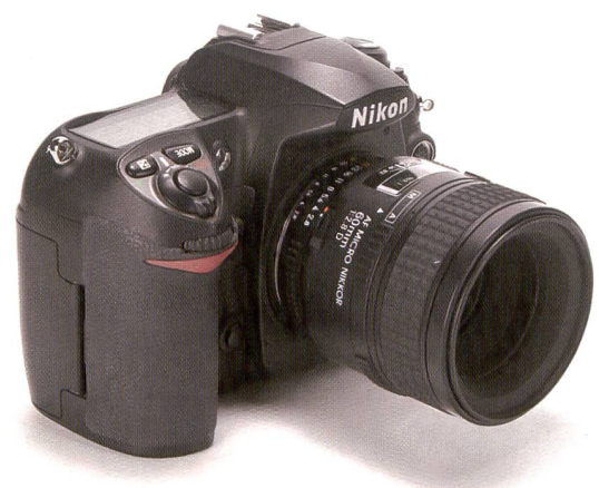
Le Nikon D200 marque des points en matière de vitesse de prise de vue en rafale. C'est l'une des raisons qui expliquent son succès commercial.

l'autofocus et de la mesure d'exposition. La seule différence extérieure du S5 réside dans la reconnaissance automatique des visages sur pression d'un bouton. Sinon, il fait preuve d'une robustesse et d'une qualité identique. La reconnaissance automatique des visages permet d'agrandir jusqu'à dix visages à l'écran di-