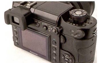
Sobriété à l'avant: le Lumix L1 remise tous les boutons sur la face arrière.

rectement après la prise de vue pour s'assurer de la qualité du résultat.