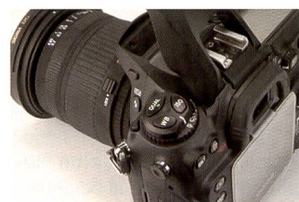
La molette intègre des boutons supplémentaires pour la balance des blancs et la sensibilité ISO.