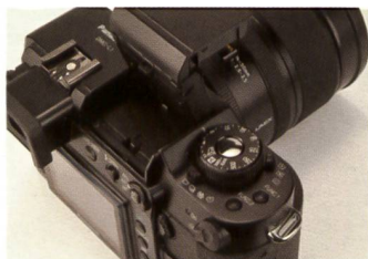
Molette de réglage grand luxe pour le réglage du temps d'obturation sur le Panasonic Lumix L1.

Nous avons déjà évoqué l'objectif Leica (le L1 est exclusivement commercialisé en kit avec celui-ci) sans toutefois préciser que son design est largement inspiré de l'élégance rétro des appareils Leica. Cette forme extérieure nostalgique,