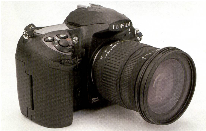
Le Fujifilm Finepix S5 Pro intègre le Super CCD exclusif de sixième génération, prometteur d'une plage dynamique étendue.

boîtier sert de champ de contrôle pour toutes les informations indispensables au photographe. Comme Fujifilm a utilisé pour le S5Pro le même «châssis» que pour le D200 de Nikon, les écrans, touches et molettes de sélection se situent aux mêmes endroits. La reconnaissance automatique des visages du S5Pro fait cependant défaut au D200. Il compense cette carence, selon ses caractéristiques techniques et des essais externes, par une meilleure rapidité en rafale de sorte qu'il est mieux adapté à la photographie de sport par exemple. Pour l'au-