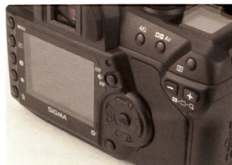
Solution astucieuse: les réglages rapides par bascule multifonctions à droite de l'écran.

l'écran est particulièrement réussi. Ce sélecteur permet en effet d'effectuer instantanément les réglages essentiels comme l'indice ISO, la balance des blancs et la résolution. Globalement, la face arrière du SD14 dégage une impression très ergonomique et structurée.