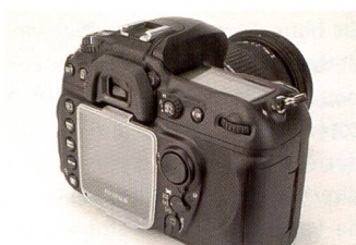
Une impression de déjà vu: de dos le Finepix S5 Pro est identique au Nikon D200.

A l'annonce de sa sortie lors de la PMA 2006, le Lumix L1 de Panaso-