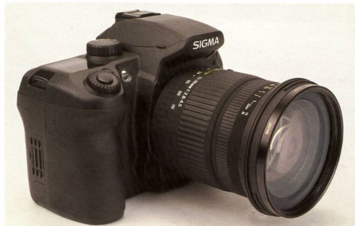
Une démarche différente: Sigma mise pour son SD14 sur le capteur CMOS X3 avec superposition de trois couches chromatiques.

En développant son nouveau SD14, Sigma a emprunté une toute autre voie que ses concurrents. Pour son premier reflex numérique (SD9), Sigma avait déjà misé sur une technique de capteur révolutionnaire de Foveon. Sans faire appel à la disposition en losange très répandue, le cons-