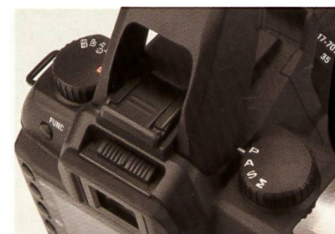
Pas moins de deux molettes de réglage sont venues agrémenter le haut du Sigma SD14

leurs plus froides (sans traitement ni pré-réglages).