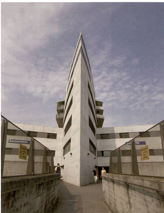
La comparaison révèle le grand angle d'image de l'objectif 28 mm signé Mamiya. Il équivaut à 17 mm environ en format 24x36.

Tout compte fait, le dos ZD-Back est un produit solide qui permet d'entrer dans l'univers de la photographie moyen format à un prix avantageux. Il est commercialisé seul ou en kit avec un Mamiya 645 AFDII et un objectif standard f2,8/80 mm à un prix de 15 990 francs (hors TVA).