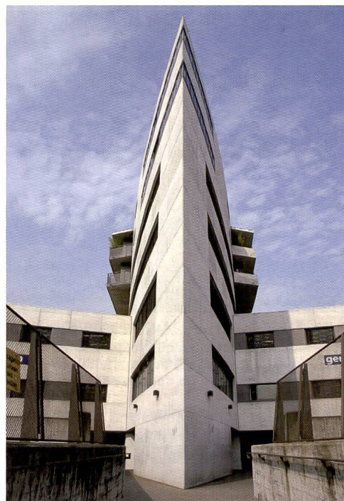
Pour réaliser cette photo, un zoom grand angulaire avec une focale de 18 mm a été utilisé sur un petit format numérique (facteur crop 1,5).

numérique d'architecture ou de studio car il offre 22 mégapixels pour à peine 13 000 francs. D'emblée, il faut toutefois concéder que le dos ZD n'a pas une rapidité idéale pour la photographie en rafale. Son temps de réaction plutôt lent se ressent surtout lorsqu'on veut visualiser des vues ou consulter des informations sur l'image. Les éléments de commande sont disposés rationnellement, la sobriété a présidé au développement. L'écran mériterait d'être un peu plus grand, mais en contrepartie l'acheteur accède à un dos délivrant de très bonnes images à un prix intéressant.