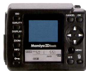
Le dos ZD de Mamiya est un appareil idéal pour les néophytes.

17mm atteindra seulement les performances d'un objectif 25mm, tandis que le grand angle Mamiya combiné au ZD numérique délivre encore l'équivalence d'un objectif 20 mm (petit format). Sans oublier un avantage supplémentaire, qui saute immédiatement aux yeux, du moyen format: l'image lumineuse et panoramique du viseur.