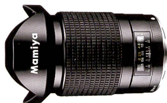
L'objectif grand angle f4,5/28 mm tant attendu de Mamiya.

Il y a un peu plus d'un an, une information a circulé dans la presse annonçant que Mamiya-OP, composé des trois secteurs d'activité Appareils photo, Golf et Appareils électronique, allait transférer son activité photo à une nouvelle société le 1er septembre 2006. Le nouveau propriétaire, Cosmo Digital Imaging, a immédiatement promis de reprendre