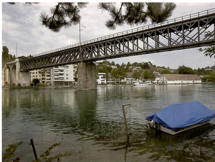
L'angle d'image de cet objectif est de 110 degrés. Il est universel et s'utilise sur tous les Mamiya 645 (AFD, AFD II). Il devrait intéresser tout particulièrement les photographes d'architecture.

Pendant longtemps, la photographie grand angle réelle a fait figure d'épouvantail pour les photographes. Dans le segment du petit format, les focales ont progressivement raccourci jusqu'à l'extrême. Dans le moyen format, Mamiya lance aujourd'hui un objectif 28 mm.