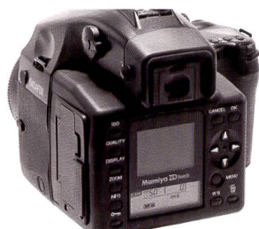
Le dos ZD se monte sans modification aucune sur le Mamiya 645 AFD et AFD II.

fichiers RAW et JPG. Grâce à cette double sauvegarde, le client peut ainsi emporter immédiatement les photos ou bien les obtenir rapidement via e-mail. Ces fichiers JPG ne sont pas a priori de simples thumbnails (vignettes) des vues