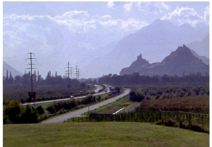
L'image du moyen format numérique stupéfait dans les tons homogènes par une totale absence de structure dans les surfaces et une très fine gradation des tonalités. Au premier plan, de faibles bruits colorés.

sera servi au mieux par la technique argentique à condition de pouvoir compter pleinement sur les services externes impliqués – labo, scanner et livreur.