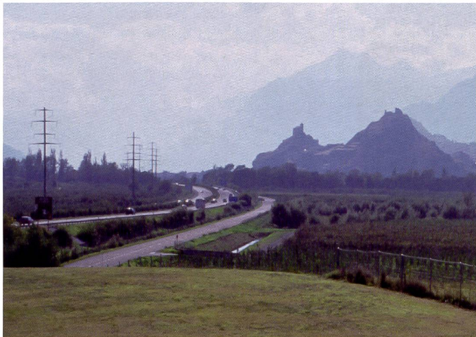
Dans le cadrage, le grain de la pellicule confère une netteté craquante aux zones détaillées. Dans les zones claires, la gradation des tonalités est moins différenciée que dans l'image numérique.

Par conséquent, il est conseillé d'étalonner également les composants numériques et de toujours sauvegarder les images JPEG parallèlement aux fichiers RAW. Ce format «retouché» peut servir d'aide-mémoire ou de référence lors du développement RAW pour déterminer le chromatisme réel de la scène originale.