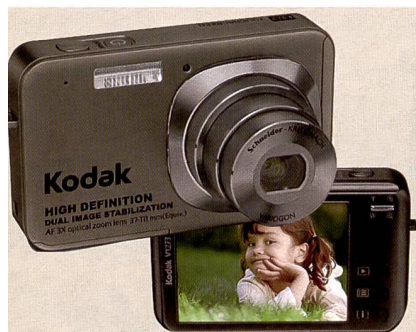
Kodak a présenté l'Easyshare V1273 et les nouveaux modèles Z (pour zoom), ci-dessous: Z8612.

Dans la catégorie des appareils à superzoom également, le cons-