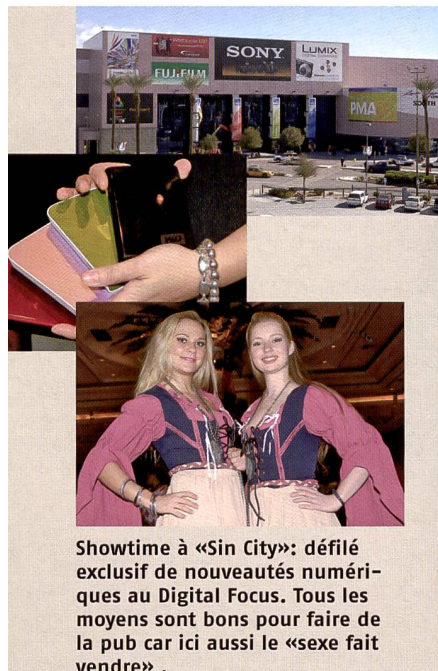
Showtime à «Sin City»: défilé exclusif de nouveautés numériques au Digital Focus. Tous les moyens sont bons pour faire de la pub car ici aussi le «sexe fait vendre».

La PMA est l'occasion de présenter de nouveaux appareils photo en bénéficiant d'une attention accrue. Dans ce contexte, il est intéressant de noter que General Electric (oui, le fabricant de lave-linge, sèche-cheveux et locomotives diesel) envisage dorénavant de commercialiser ses appareils numériques sur le