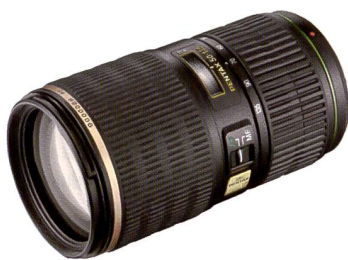
Objectif zoom Pentax SMC DA f/2,8/50-135 mm pour le K20D.

Pentax a lancé fin février deux modèles s'inscrivant comme précurseurs de la nouvelle série star d'objectifs DA. Ils se distinguent par un moteur ultrasonique intégré, spécialement mis au point pour les reflex numériques Pentax.