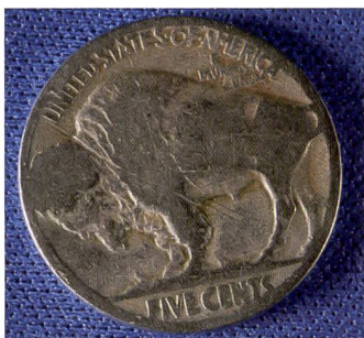
Macrographie avec l'AF-S f/2,8/60 mm G ED Micro Nikkor.

stabilisateur d'image lorsque le photographe suit un objet en mouvement dans le sens horizontal ou vertical. La détection du trépied optimise automatiquement le travail du stabilisateur dans la prise de vue sur trépied.