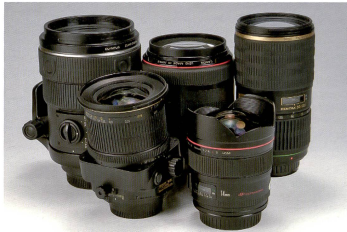
Nous avons, entre autres, testé les objectifs suivants: Canon EF f/1,2/85 mm II USM, PC-E Nikkor f/3,5/24 mm D ED T&S, Olympus Zuiko Digital f/2,0/150 mm, Pentax SMC DA f/2,8/150-135 mm.

Les ventes dérivées sont indispensables pour le commerce de détail. Parallèlement aux cartes mémoire, sacs, trépieds, flashes, etc., les objectifs sont un vecteur clé du chiffre d'affaires mais aussi un facteur de qualité souvent sous-estimé.