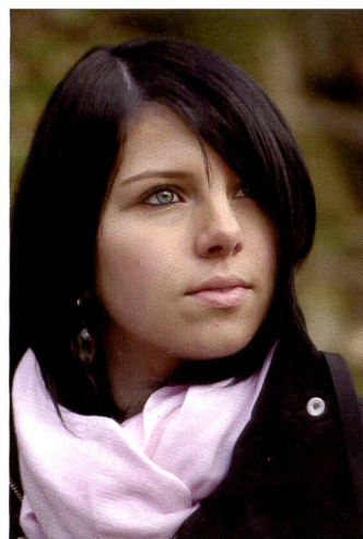
Le Pentax lumineux SMC DA f/2,8/50-135 mm génère aussi des flous esthétiques.

Le «Quick Shift Focus System» permet au photographe de modifier le réglage focal à sa guise, une fois la mise au point réalisée. Il peut également corriger précisément la mise au point momen-