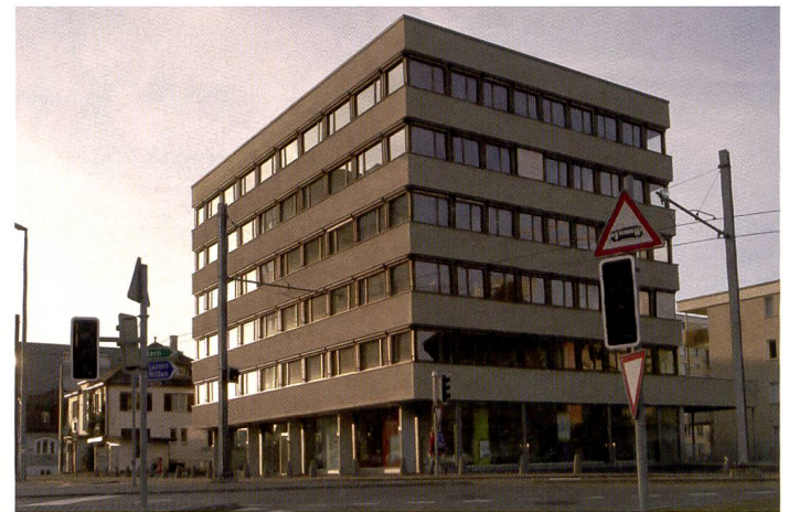
Le mouvement de bascule du PC-E Nikkor f/3,5-24 mm D ED T&S conserve le parallélisme des lignes. Lorsque les bâtiments ont plus de trois étages, mieux vaut ne pas corriger la perspective à 100% car le naturel en pâtit.

L'objectif possède une zone de basculement/décentrement permettant un pivotement du système de lentille jusqu'à \pm 8,5^\circ ou un déplacement de \pm 11,5 mm. En raison de leur forme de construction, ce type d'objectifs ne dispose pas d'une motorisation AF et nécessite une mise au point manuelle. Une touche de mesure de la profondeur de champ est intégrée à l'objectif. Pour profiter au maximum des fonctions du PC-E, mieux vaut monter l'appareil sur un trépied. Pour obtenir des lignes parallèles, c.-à-d. éviter les lignes convergentes, le boîtier doit par ailleurs être ni-