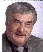
Urs Tillmanns Photographe, journaliste spécialisé et éditeur de Fotointern