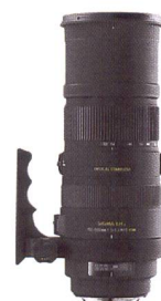
SIGMA APO-Zoom 150-500 mm F5,0-6,3 DG OS HSM