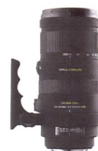
SIGMA APO-Zoom 120-400 mm F4,5-5,6 DG OS HSM

Les traitements les plus avancés appliqués à l’objectif éliminent les images parasites qui pourraient se former par réflexion à la surface du sensor et assurent un rendu des couleurs neutre sur toute la gamme focale. La distance minimum de mise au point de seulement 150 cm pour toutes les focales donne une échelle de reproduction maximum de 1:4,2. Le HSM (Hyper Sonic Motor) assure une mise au point rapide et silencieuse et permet, à tout instant, une intervention manuelle. Les éléments optiques de mise au point sont placés à l’intérieur de l’objectif ce qui rend aisément possible l’utilisation d’un filtre polarisant circulaire. De plus, la longueur de construction de l’objectif ne se modifie pas durant la mise au point.