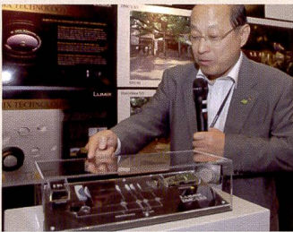
Présentation des produits: ci-dessous le Lumix FX37, à droite le LX3.