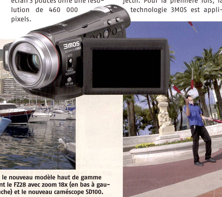
Toutes les photos ont été prises avec le nouveau modèle haut de gamme Lumix LX3. Les autres nouveautés sont le FZ28 avec zoom 18x (en bas à gauche), le FX150 14 MPix (en haut à gauche) et le nouveau caméscope SD100.