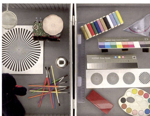
La qualité des images est évaluée à l'aide de clichés de comparaison. Pour garantir un bon résultat, l'objectif est tout aussi important que l'appareil photo lui-même

sateurs d'appareils photo, qu'ils soient photographes professionnels ou amateurs. Si ces utilisateurs plébiscitent un modèle spécifique parce qu'il répond à leurs besoins, ce dernier a pour ainsi dire remporté le test - indépendamment des conclusions de tests publiées dans les revues spécialisées et les forums en ligne.