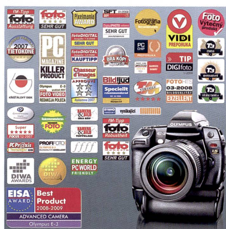
Un petit aperçu de la collection de récompenses de l'E-3. Les spécialistes ne tarissent pas d'éloges vis-à-vis du produit phare d'Olympus.

l'Olympus E-3 a été couronné récemment «Best Advanced Camera 2008/09». Par ailleurs, le compact étanche et extrêmement robuste Olympus \mu 1030 SW a également remporté un prix, en l'occurrence celui de «Best Product» dans la catégorie «Ultra Compact Camera».