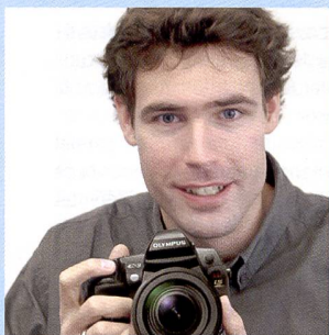
Mister E Christian Reding Spécialiste de