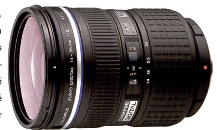
Extrêmement lumineux: f/2,0 /14 - 35 mm (équi. 28 - 70 mm).

Le mois de décembre n'est pas encore là, mais les villages et villes suisses vont néanmoins installer leurs illuminations de Noël dans les semaines à venir. La balance automatique des blancs est très fiable également pour ce type de photos. Amusez-vous quand même à expérimenter différents réglages de la balance des blancs. Si vous testez les possibilités du format RAW (.ORF) d'Olympus, la balance des blancs peut être modifiée ultérieurement sur un Mac/PC. Ne laissez pas passer cette occasion de réaliser cette année vos propres cartes de vœux, bien sûr avec un appareil du système E ;)