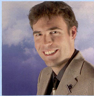
Mister E Christian Reding Spécialiste de

Olympus Suisse SA, Chriesbaumstrasse 6, 8604 Volketswil, tél. 044 947 66 62, fax. 044 947 66 55, www.olympus.ch. Discover your world.