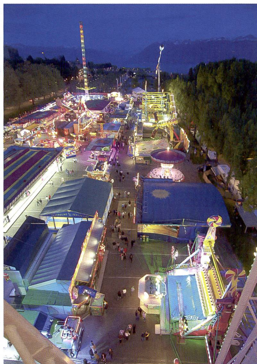
En route avec l'objectif lumineux Zuiko Digital Pro f/2,8-3,5 / 11 - 22 mm : photo de reportage de Daniel Kägi [E-3; 1/20s; 1:2,8; 400 ISO; stabilisateur d'image].

Des questions? – «Mister E» Christian Reding se réjouit de vos appels.