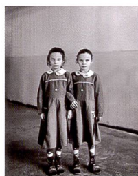
Le portrait gagnant de Vanessa Winship l'an dernier.

Les Sony World Photography Awards (SWPA) seront décernés pour la deuxième fois en 2009. La coopération avec «Prince's Rainforest Project» (PRP) a été annoncée en septembre 2008.