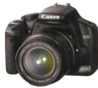
iPF6000S: EOS 450D + EF 18-55mm IS + EF 55-250mm USM + SanDisk SD 4,0 GB = CHF 1350.-

Offrez-vous le summum du grand format et une grosse récompense