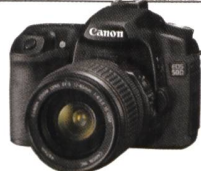
iPF820: Canon EOS 50D + EF-S 18-200mm IS = CHF 2100.-