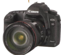
iPF9100: Canon EOS 5D Mark II + EF 24-105mm IS = CHF 4200.-