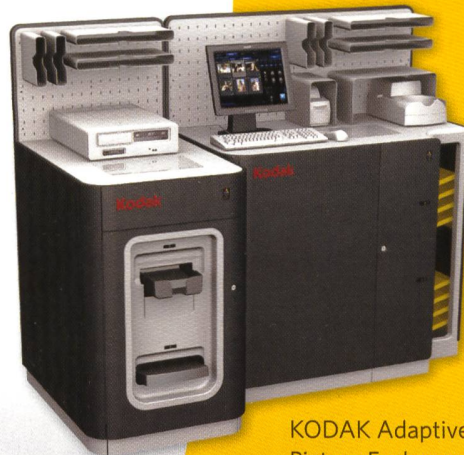
KODAK Adaptive Picture Exchange 74"