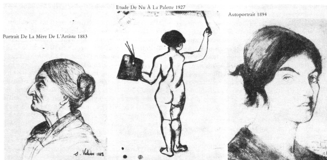
Zeichnungen von Suzanne Valadon 1885 - 1938

Nachdem mir diese Zusammenhänge klar geworden waren, holte ich einen Taschenspiegel und eine Lampe, um endlich wieder einmal meine Genitalien zu betrachten - diesmal ohne Scham, erwartungsvoll und lustbetont, wie es Betty Dodson ihre Frauen im Bodysex Workshop tun lässt. Ich fand, dass meine "Scham"-Lippen gar nicht abnormal sind, da ich gelesen hatte, dass dieser Typ bei vielen Frauen anzutreffen ist. Die merkwürdigen Farben und Formen stiessen mich nicht mehr ab, ich fand sie schön und fühlte, dass ich stolz war auf sie. Ich änderte darauf meinen anatomischen Wortschatz: der Begriff "Scham" wurde endgültig verbannt! Die "Scham"-Lippen wurden zu Blumenlippen, "die Scham" heisst bei mir "das Wunder" und mein "Scham"-Haar ist mein Blütengarten etc. Von da an fühlte ich mich freier, da ich an meinem Körper nun nichts mehr habe, was ich verheimlichen müsste oder was mir unangenehm wäre. Ich begann auch - nach über 15 Jahren (ich bin 30, und 8 1/2 Jahre verheiratet) - wieder regelmässig zu onanieren und spüre, dass meine sexuelle Unabhängigkeit zunimmt. Meine Orgasmen sind unterschiedlich, je nachdem, ob ich mich vorher selbst stimuliert habe oder ob ich sie mit meinem Partner erlebe. Und endlich begreife ich, dass jeder Mensch ein sexuell selbständiges We-