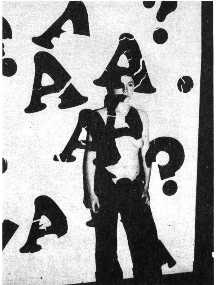
— selbstgemachte dias auf den eigenen körper projiziert —

der familie, der erziehung, der ernährung usw. nicht einmal dort sind wir ohne bevormundung. immer wenns kreativ wird, sind sogleich männer zur stelle. mann hat den frauen, den weiblichen menschen erfolgreich eingetrichtert, sie seien zu irgendwelcher schöpferischer tätigkeit im normalfall ungeeignet. sie seien höchstfalls als interpretinnen (musik, theater) als musen, modelle, freundinnen von schöpferischen männern denkbar, und die wenigen (bestimmt gabs viel mehr) bekannten fälle von produzierenden frauen werden als "sie war ein halber mann", "eigentlich ist ein mann an ihr verloren gegangen" usw. abgetan. von den vielen fällen von schlichter unterschlagung des eigentlichen urhebers einer erfindung, eines werks ganz zu schweigen. die frauen haben begonnen, die geschichte genauer zu überprüfen, und es ist gewiss nicht eine feministische übertreibung, sondern langsam eine tatsache, dass es viel mehr kreative frauen gab und gibt, als behauptet wird. in vielen fällen mussten die frauen sich als männer kleiden, mit männernamen signieren, oder unter dem namen des vaters, bruders, ehemannes oder sohnes arbeiten. (zeitmagazin nr. 9/20 febr. 76) frauenbuchladen.