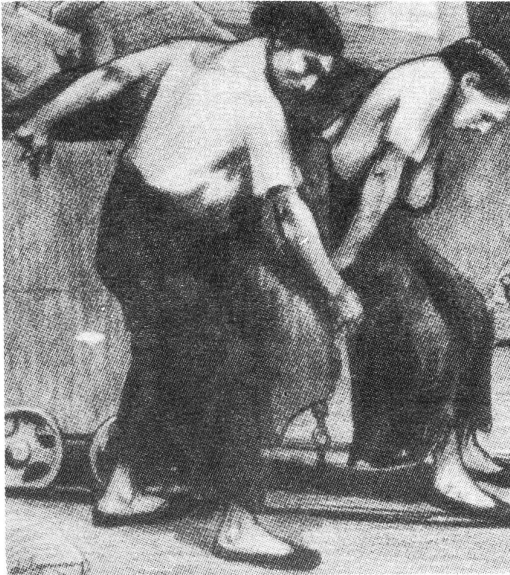
Die Frau als Arbeitstier

Mit fortschreitender Technisierung und zunehmender Arbeitsteilung versteht es der Unternehmer, immer unqualifiziertere, billigere Arbeiter einzustellen, wozu - natürlich - auch Frauen und Kinder gehören.