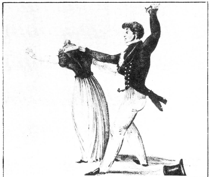
Die Frau als Sklavin ihres Mannes

August Bebel habe nach Alexandra Kollontai eines der umfassendsten Werke in dieser Richtung schon um 1870 herum geschrieben: "Die Frau im Sozialismus" (Kenn ich noch nicht).