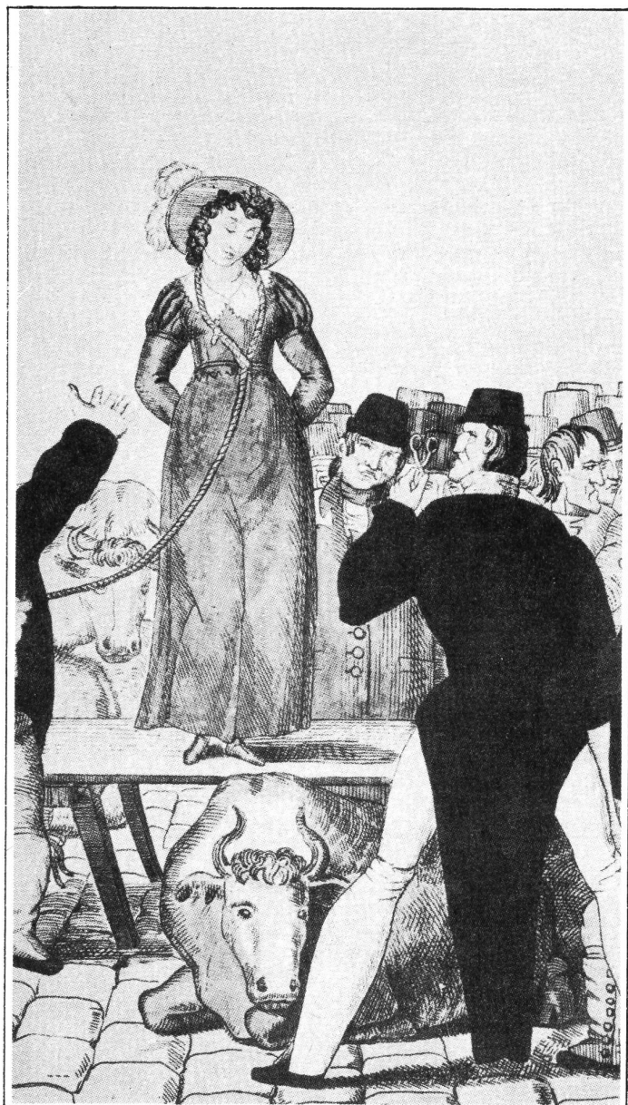
Heiratsmarkt in England 19 Jh.

Das Problem der Frauenemanzipation - sowohl materiell als auch geistig - ist eng verbunden mit dem der Umwandlung des Familienlebens. Es ist nötig, die Barrieren der engen und erstickenden Käfige, in denen die bestehenden Familienstruktur die Frau gefangen hält und sie so zur Sklavin, oder gar zu einem Lasttier, macht, zu beseitigen. Das kann nur geleistet werden durch die Organisierung gemeinschaftlicher Ernährung und Kindererziehung.