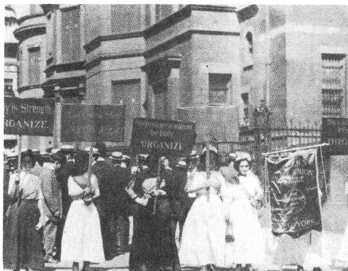
Suffragettendemonstration in New York für bessere Arbeitsbedingungen

Die IV. Internationale, mit Trotzki, sah schon sehr konkret die Emanzipation der Frau in Zusammenhang mit der Emanzipation respektive der Auflösung der Familie.