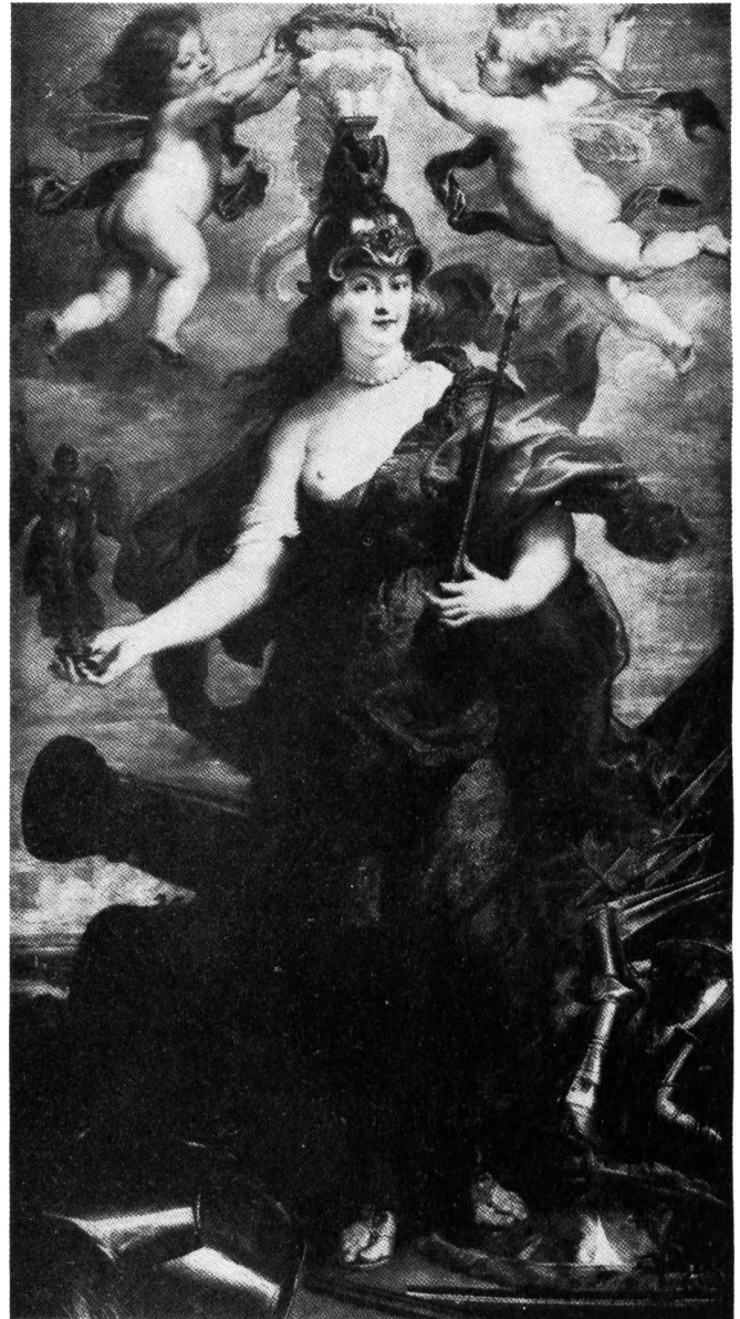
Rubens: Maria del Medici

Zum Thema "Die Kommunistische Partei Frankreichs und die Frauenfrage 1920 - 1939" kommentierte ein Historiker von seiner Sicht aus seine ausführlichen Untersuchungen, während sich die einzige Französin mit "Adelheid Popp: Hoffungen und Enttäuschungen" (eine der bedeutendsten Frauen der österreichischen Sozialdemokratie), befasste.